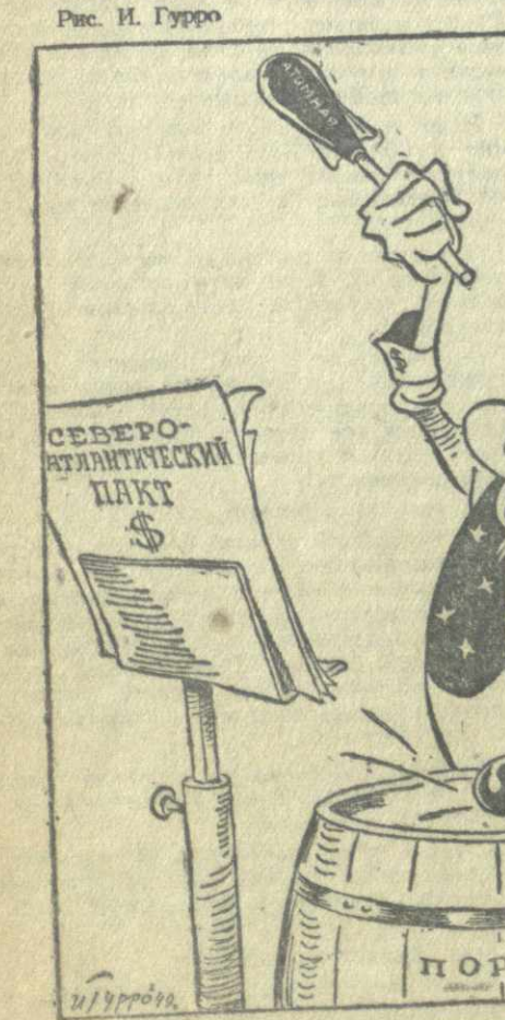
Рис. И. Гурро СЕВЕРО-АТЛАНТИЧЕСКИЙ ПАКТ ПОРОХ