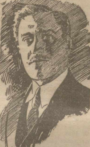
Председатель Аджаристанского суда, ХИМИШВИЛИ.