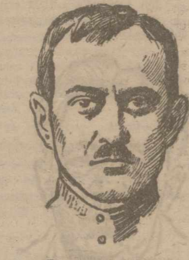
Председатель Тифлиского суда, Я. ВАРДИЗЕЛИ.