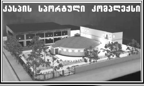
ქასპის სპორტული კომპლექსი