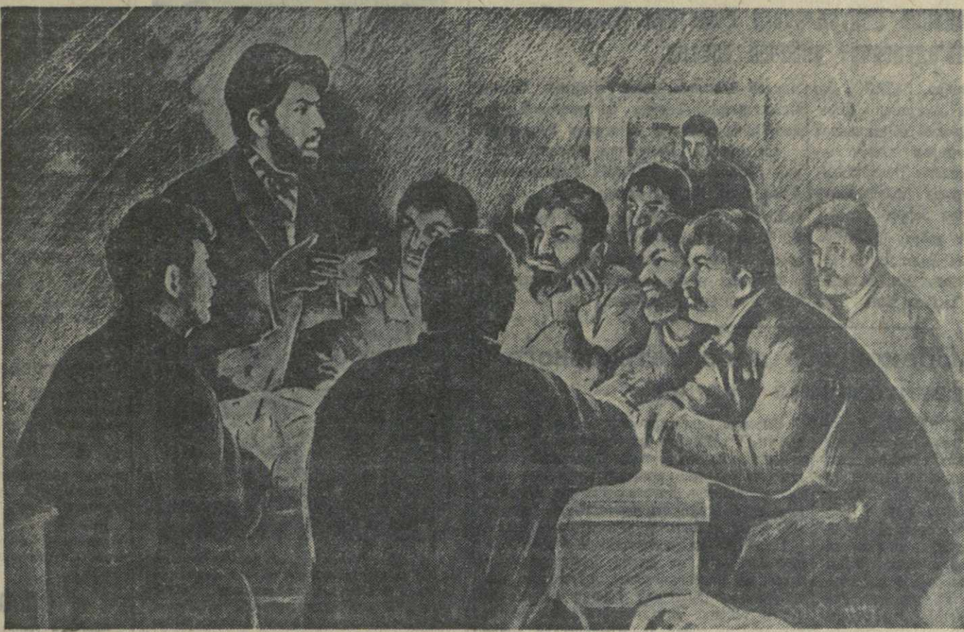
Товарищ Сталин в первом рабочем кружке в Тифлисе, 1898 г.

50-летие декабрьской забастовки в Главных мастерских и депо Закавказских железных дорог