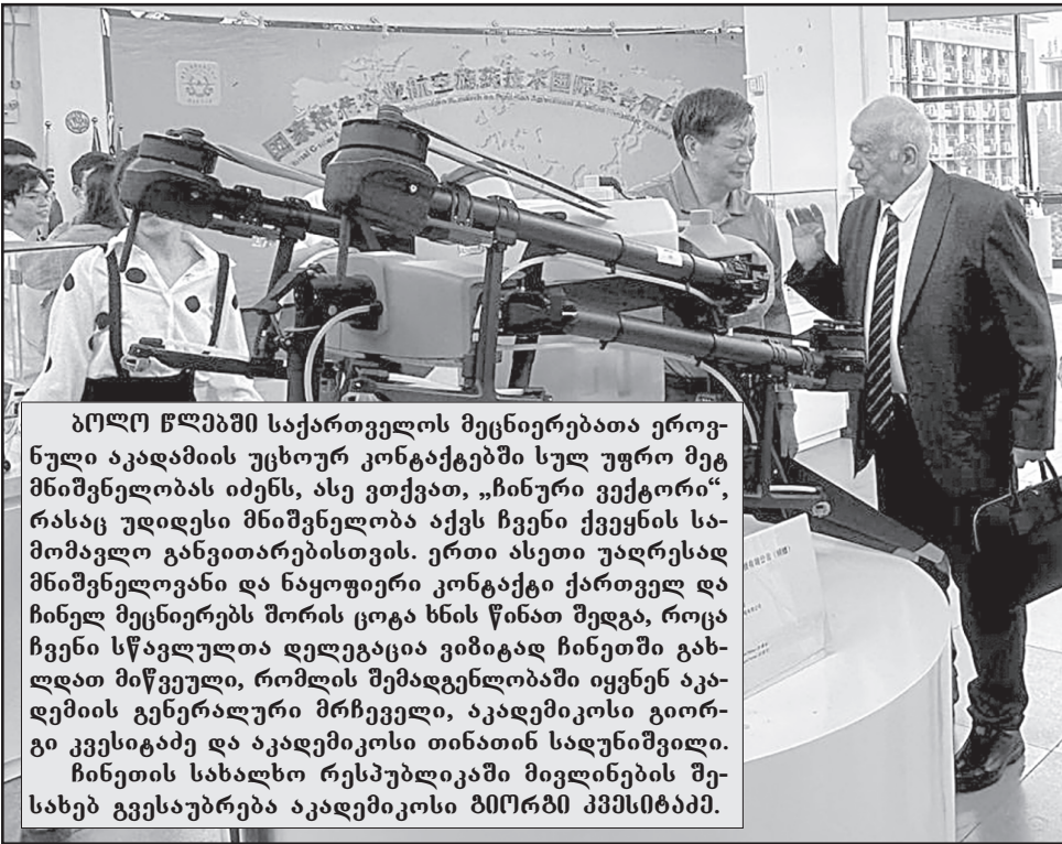
ბოლო წლებში საქართველოს მეცნიერებათა ეროვნული აკადემიის უცხოურ კონტაქტებში სულ უფრო მეტ მნიშვნელობას იძენს, ასე ვთქვათ, „ჩინური ვექტორი“, რასაც უდიდესი მნიშვნელობა აქვს ჩვენი ქვეყნის სამომავლო განვითარებისთვის. ერთი ასეთი უაღრესად მნიშვნელოვანი და ნაყოფიერი კონტაქტი ქართველ და ჩინელ მეცნიერებს შორის ცოცხლის წინაშე შედგა, როცა ჩვენი სწავლულთა დელეგაცია ვიზიტად ჩინეთში გახლდათ მიწვეული, რომლის შედეგად ჩინეთში იყვნენ აკადემიის გენერალური მრჩეველი, აკადემიკოსი გიორგი კვეციანი და აკადემიკოსი თინათინ სადუნიშვილი. ჩინეთის სახალხო რესპუბლიკაში მივლინების შესახებ გვესაუბრება აკადემიკოსი ბიორბი კვანცია.