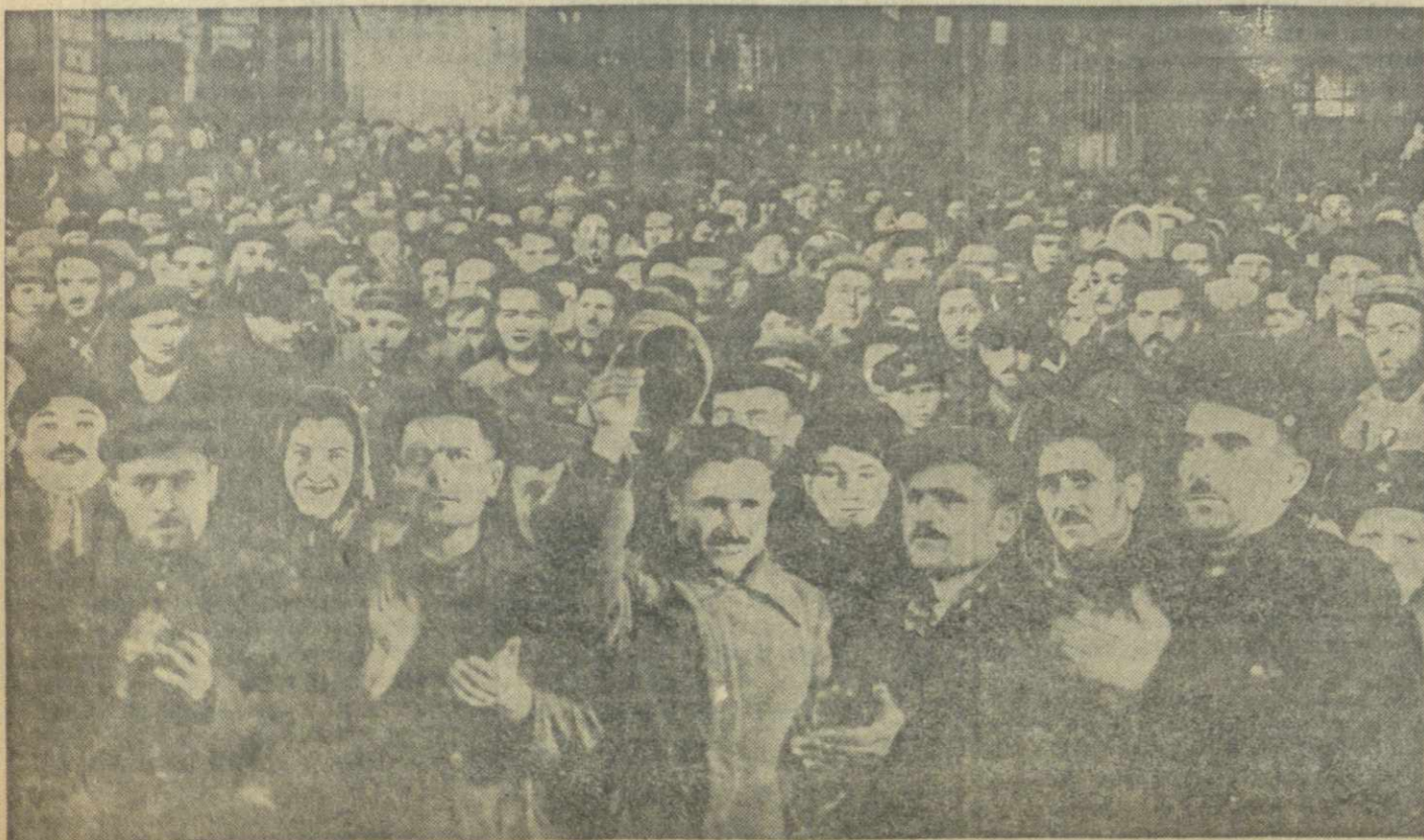
На предвыборном собрании рабочих, инженерно-технических работников и служащих Тбилисского паровозо-вагоноремонтного завода имени Сталина 4 февраля 1950 года.

2. Просить товарища Иосифа Виссарионовича Сталина дать свое согласие баллотироваться в депутаты Совета Союза Верховного Совета СССР по Сталинскому избирательному округу города Москвы от рабочих, инженеров, техников и служащих Московского электростроительного завода. (ТАСС).