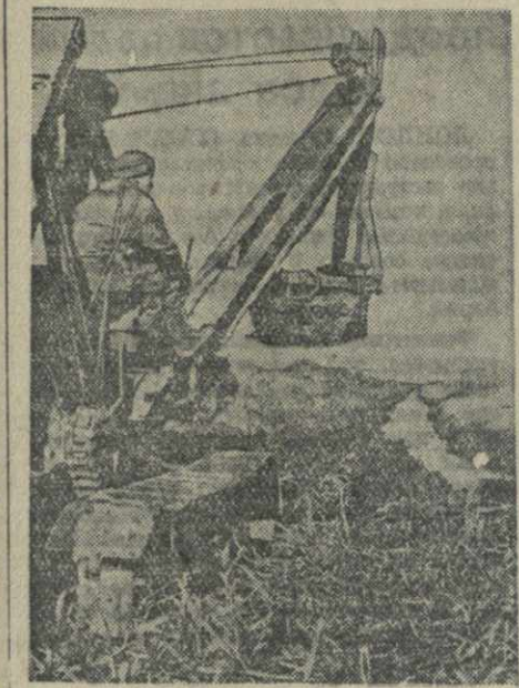
В центральной части Колхидского нагорья в послевоенной пятилетке должно быть осушено 20 тысяч гектаров заболоченных земель. На снимке: экскаватор за работой осушительного канала.

Г. ГЛЕЗЕРМАН, кандидат философских наук.