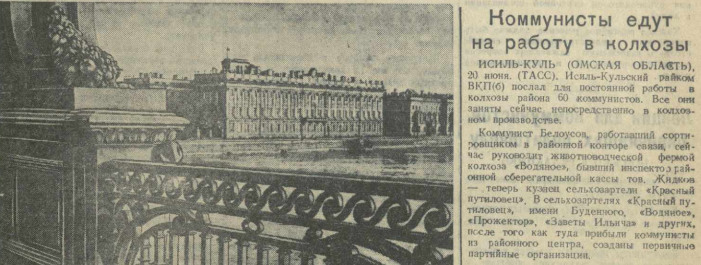
Ленинград. Вид с Кировского моста на Ленинградский филиал Музея В. И. Ленина.

В совхозах и колхозах Курганской области выведена новая порода крупного рогатого скота, которой присвоено название «Курганская». Характерная особенность этой породы — высокая молочная продуктивность, крупные размеры, приспособленность к условиям суровой зимы Зауралья. В молоке коров курганской породы содержится четыре процента жира.