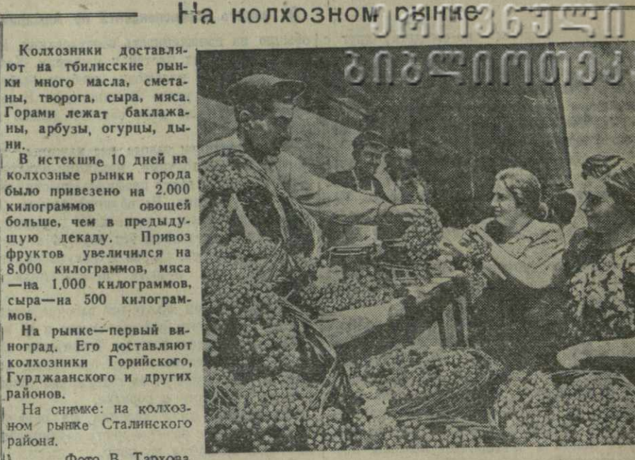
На колхозном рынке