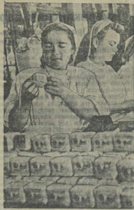
Во все концы нашей страны рассылают свою продукцию Тбилисская черзавесочная фабрика. На снимке: в упаковочном цехе фабрики.