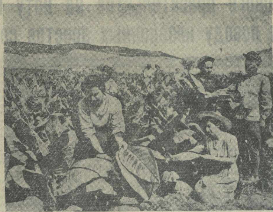
Высокий урожай табака зреет на плантациях колхоза селения Болнис-Хаччи, Болнисского района. Табакотводители обязались убрать в текущем году со всей площади по 25 центнеров, а с 4 гектаров — по 28 центнеров.

Бригады актеров, музыкантов, танцоров побывали у колхозников Шителкартского, Сивахского, Казретского, Хашурского, Каспского и других районов. Сейчас они выступают в Тбилиском, Марнеульском, Чхорцкском и Гардабанском районах.