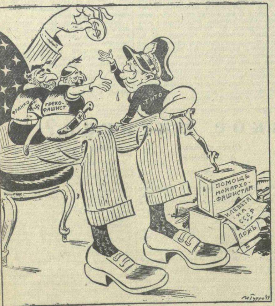
Рис. И. Гурро.

Кляка Тито разоблачена, как банда предателей, перебивавшая в лагерь империализма и реакции.