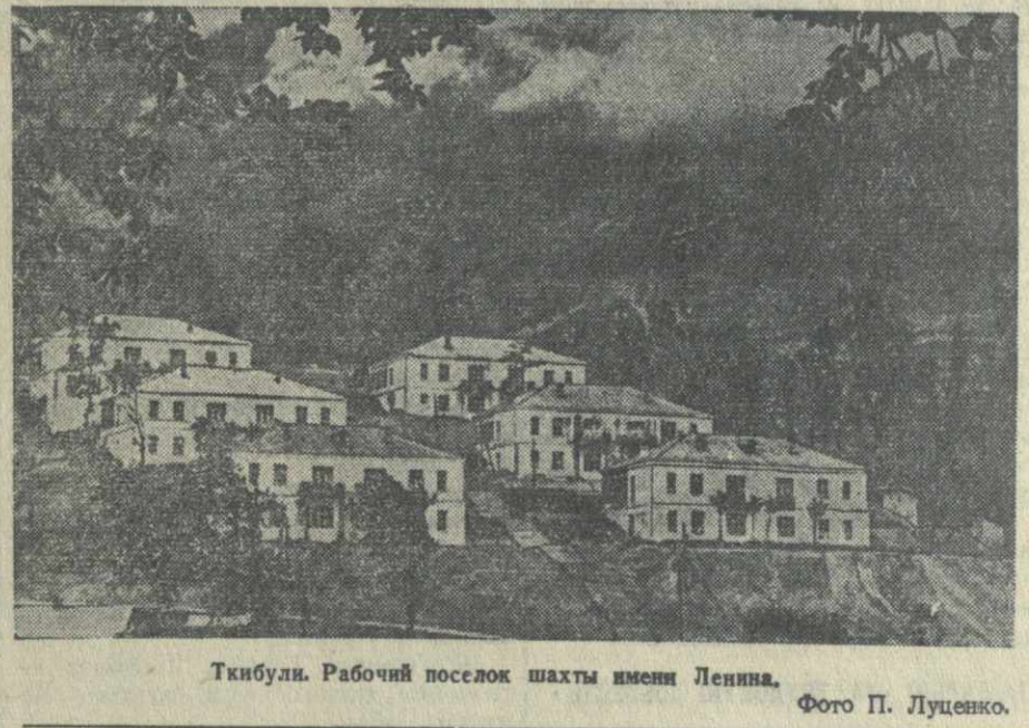
Тибули. Рабочий поселок шахты имени Ленина.

ТИБУЛИ. (Наш корр.). В Тибули построили партия стандартных домов, состоящих из двух комнат с балконом, кухни, кладовой и ванной.