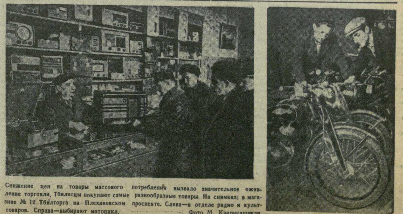
Снижение цен на товары массового потребления вызвало значительное оживление торговли. Тбилисцы покупают самые разнообразные товары. На снимках: в магазине № 12 Тблиторга на Пехановском проспекте. Слева — в отделе радио и культурных товаров. Справа — выбирают мотоцикл.

Министерство автомобильной и тракторной промышленности СССР увеличивает выпуск автомобилей для продажи населению. В 1949 году было продано автомашин «Москвич» и «Победа» в два раза больше, чем в предыдущем году. Сейчас сеть специализированных автомобильных магазинов значительно расширяется. В нынешнем году будет открыто 26 таких магазинов. (ТАСС).