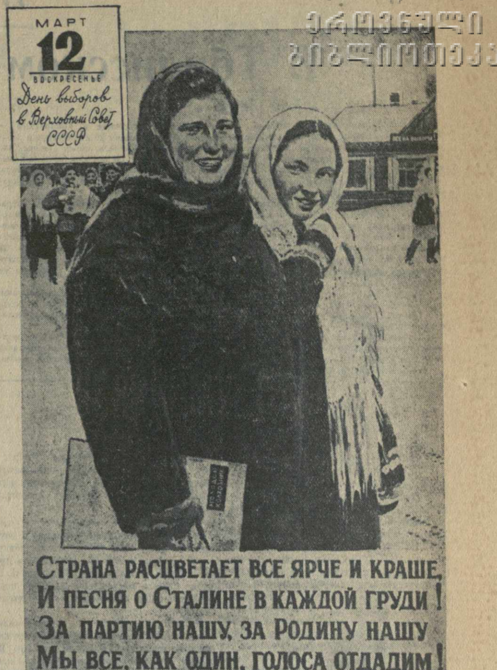
Плакат работы художника Н. Жукова (издательство «Искусство»).