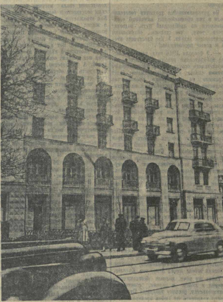
Новый жилой дом на Вокзальной улице. В ближайшие дни начнутся работы по расширению этой улицы. После реконструкции она будет иметь в ширину 28 метров, вместо нынешних 17 метров.