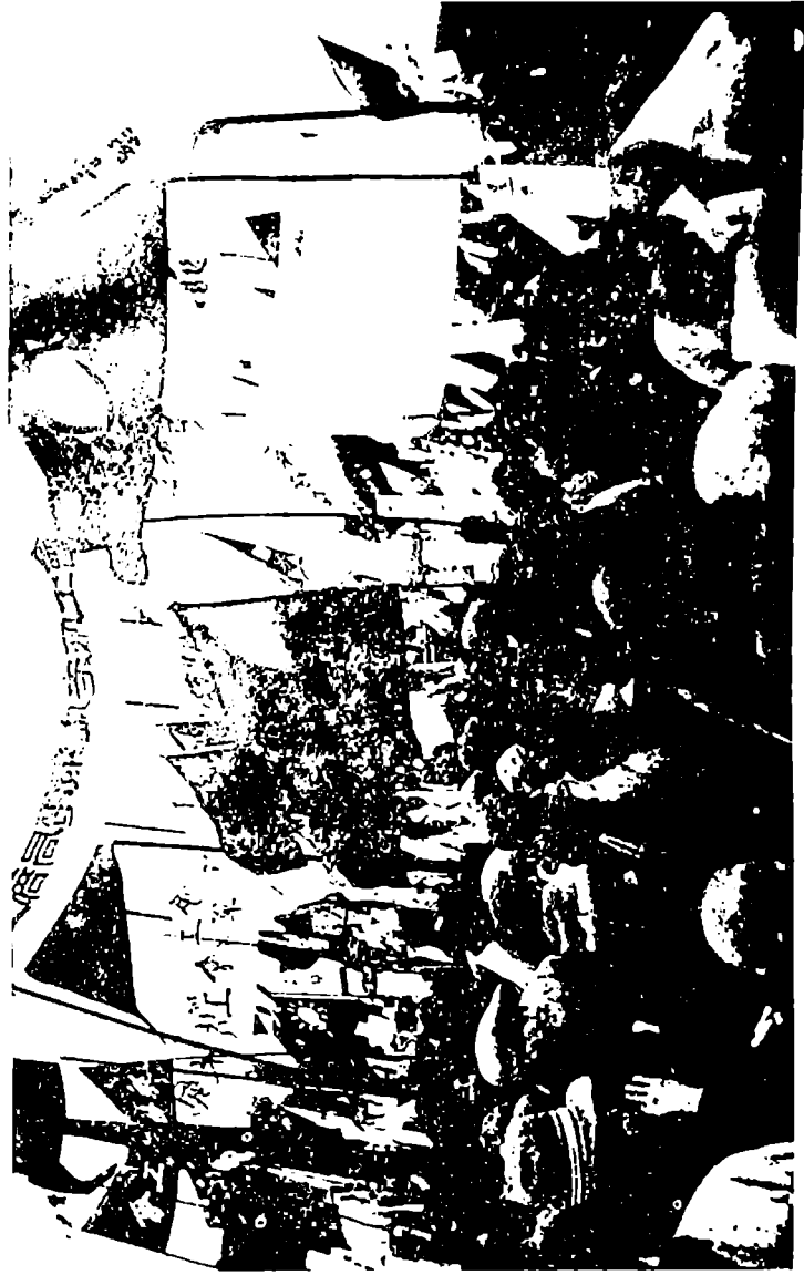
შანსაის მუშეობის ერთ ერთი მიტინგი ჩაბკეში.