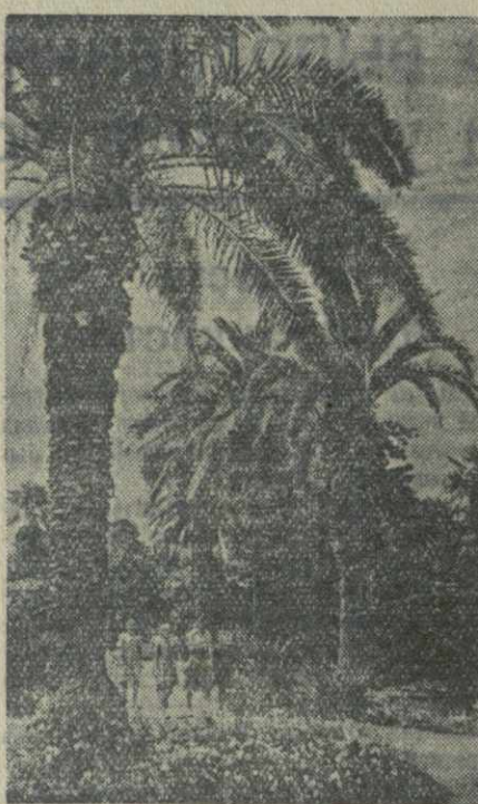
На Приморском бульваре в г. Сухуми.

МОНУМЕНТ И. В. СТАЛИНА ВАНИ. (Нам корр.). В районном центре — селе Вани установлен монумент И. В. Сталина. Высота монумента — 5 метров.