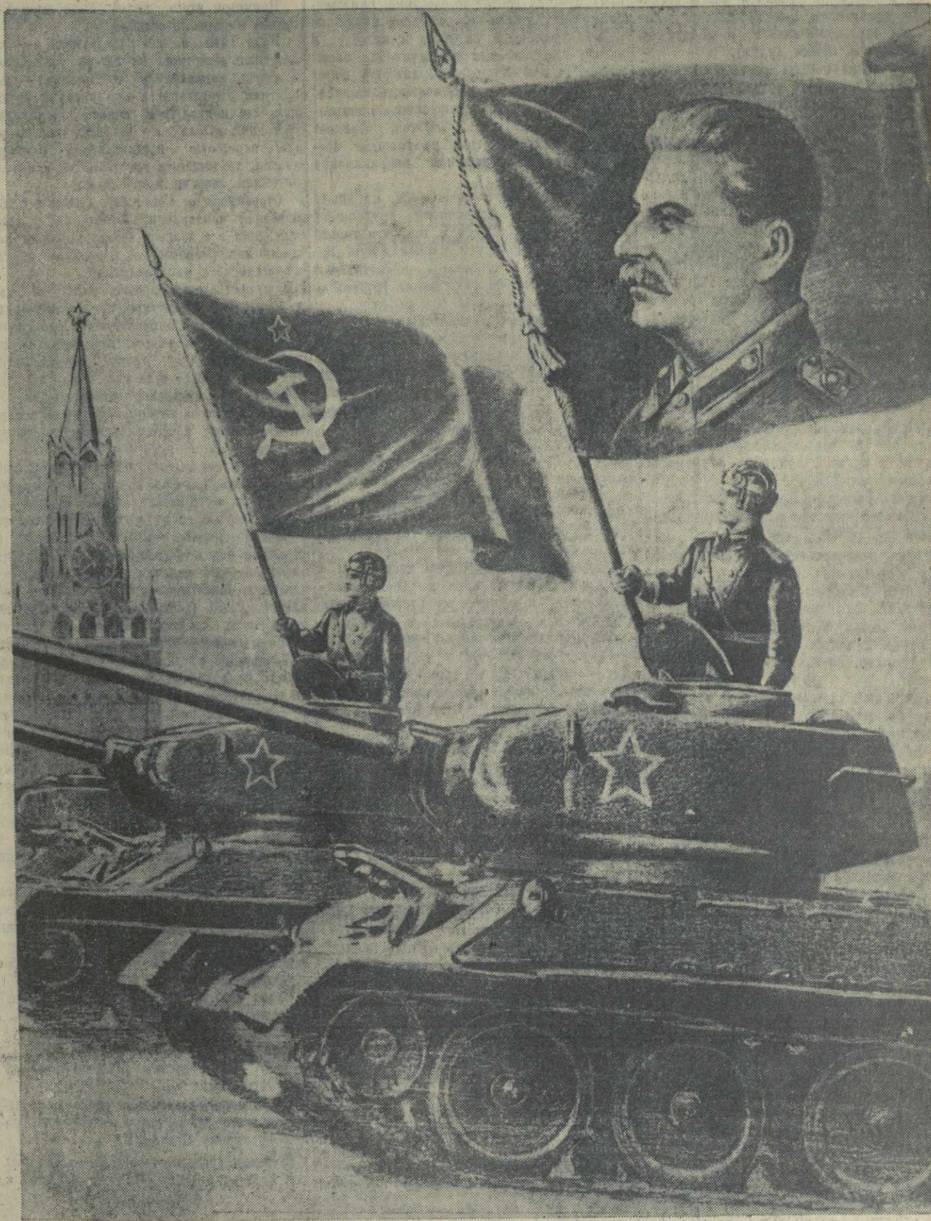
Рисунок художника А. Кручини.