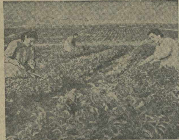
Формовка чайных кустов в колхозе «Ахали сопели» сел. Ахали сопели Гурьянского района.