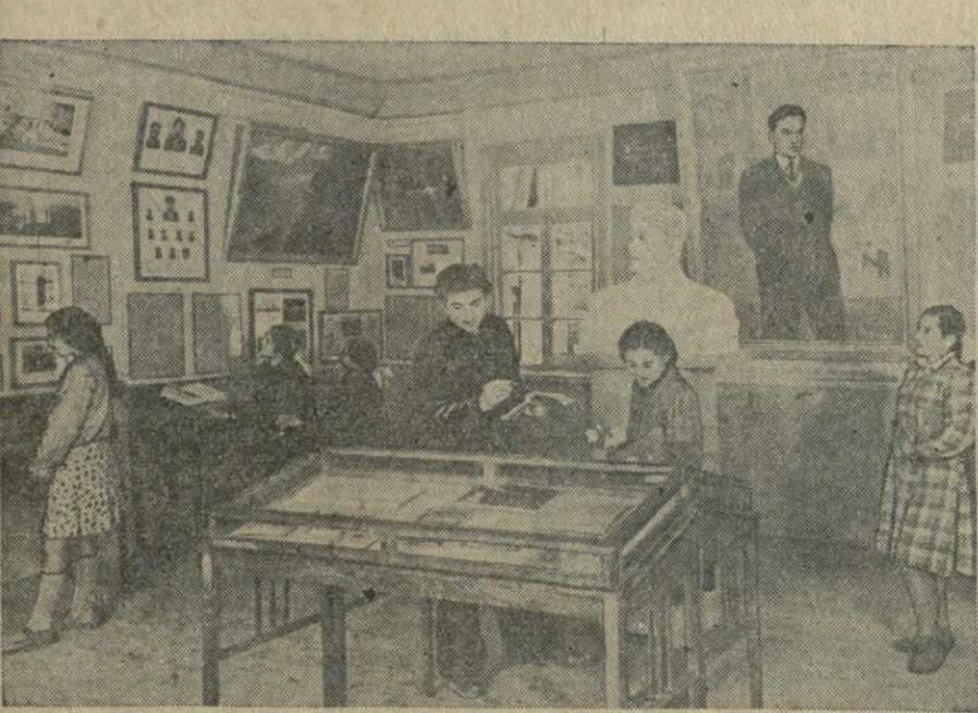
14 апреля исполняется 20 лет со дня смерти великого советского поэта В. В. Маяковского. В связи с приближением годовщины значительно усилился приток экскурсантов в Дом-музей В. Маяковского, на родине поэта в селе Маяковский. На снимке: одна из комнат Дома-музея В. Маяковского.

При клубе работают драматический, агрономический, литературный и шахматный кружки. Недавно организован колхозный ансамбль песни и пляски, создана также агитационно-художественная бригада.