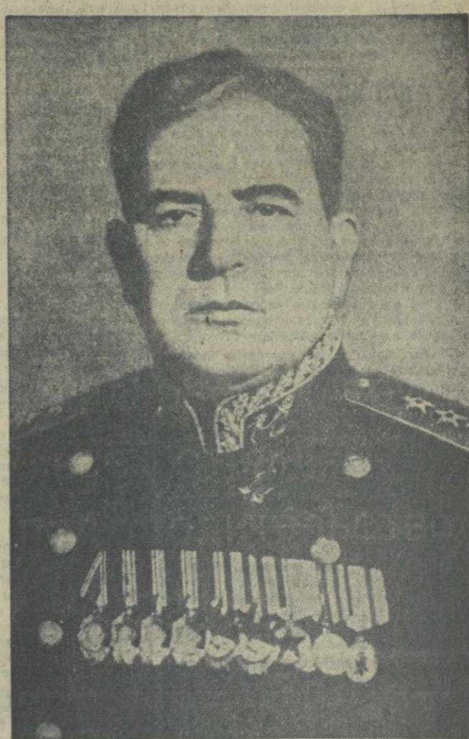
Военно-Морской Министр Союза ССР адмирал И. С. ЮМАШЕВ.