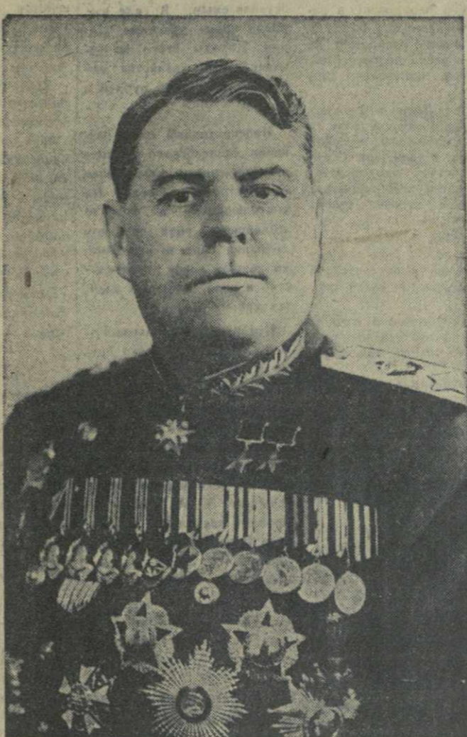
Военный Министр Союза ССР Маршал Советского Союза А. М. ВАСИЛЕВСКИЙ.