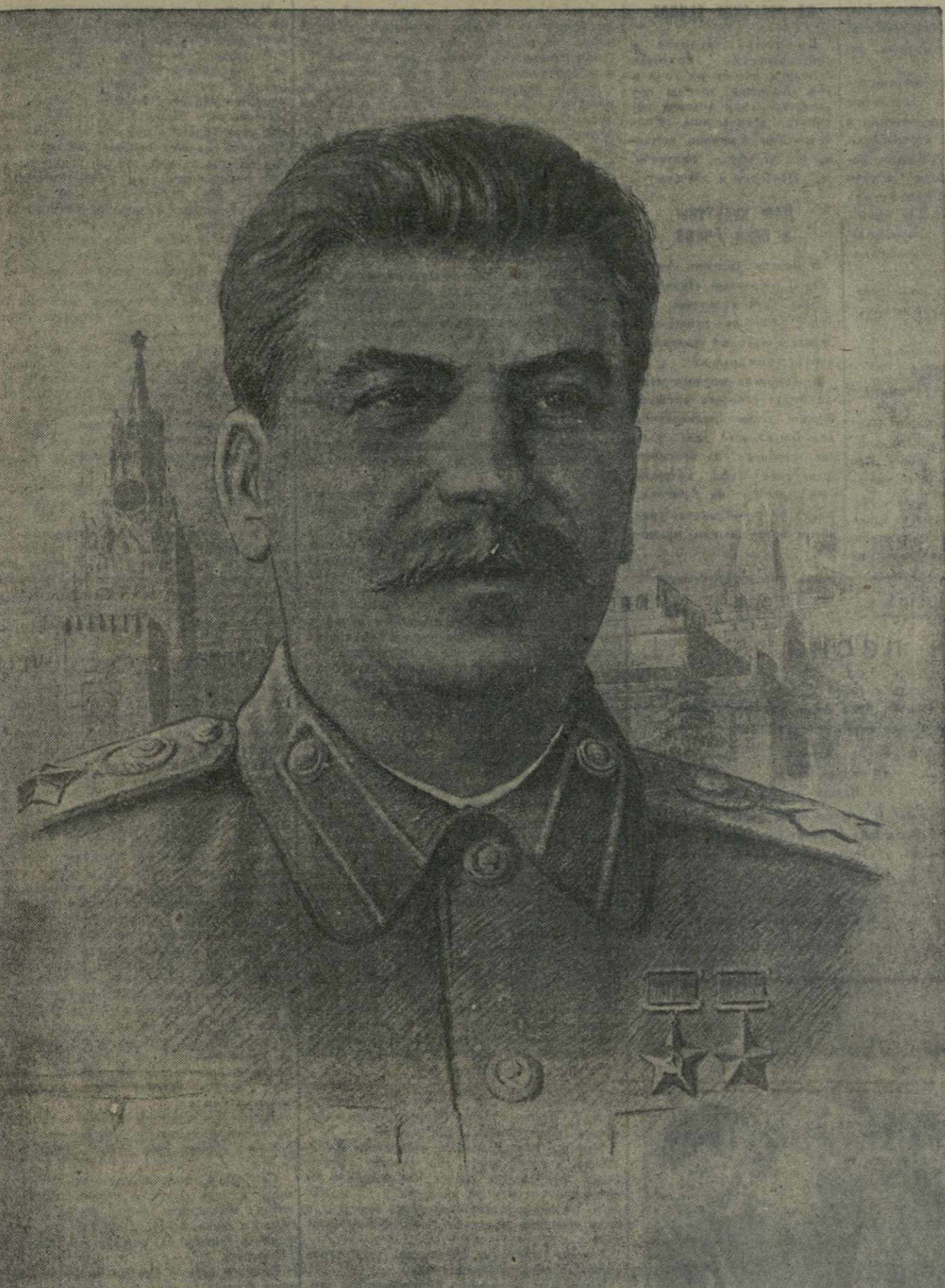
Иосиф Виссарионович СТАЛИН.

Под знаменем ЛЕНИНА, под водительством СТАЛИНА — вперед, к победе коммунизма!