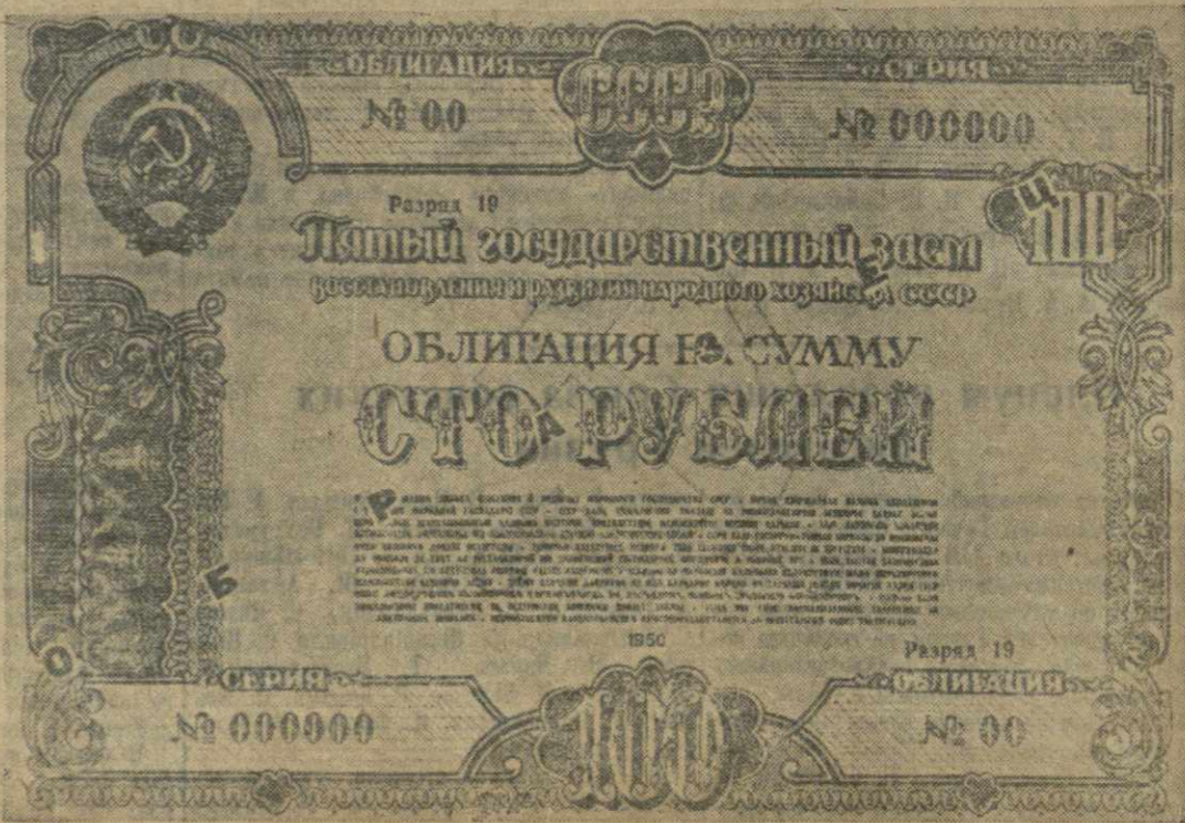
Образец облигации Пятого государственного займа восстановления и развития народного хозяйства СССР достоинством в 100 рублей.

Подписка на Пятый государственный заем восстановления и развития народного хозяйства СССР дружно проходит во всех районах Аджарии.