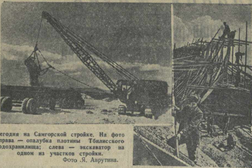
Сегодня на Самгорской стройке. На фото справа — опалубка плотным Тбилисского водохранилища; слева — экскаватор на одном из участков стройки.

Ш. ГОГИДЗЕ, инструктор Гареубанского райкома ТО КП(б) Грузии.