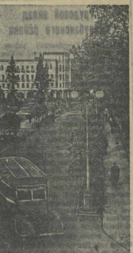
Кутаиси. На ул. имени Сталина.