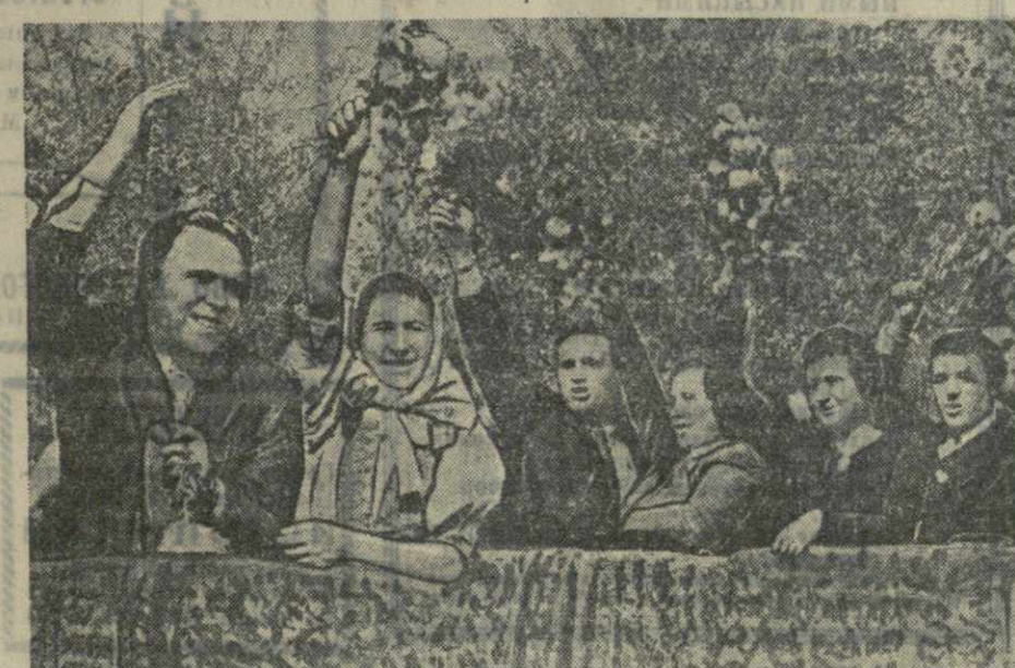
На снимках: 7 ноября в Тбилиси. Слева сверху — студенты-физкультурники района имени Орджоникидзе проходят по площади имени Л. П. Берия. Слева внизу — колонна трудящихся района имени Сталина на проспекте Руставели. Справа сверху — идут учащиеся тбилисских школ. Внизу — группа чехословацкой крестьянской делегации приветствует демонстрантов.