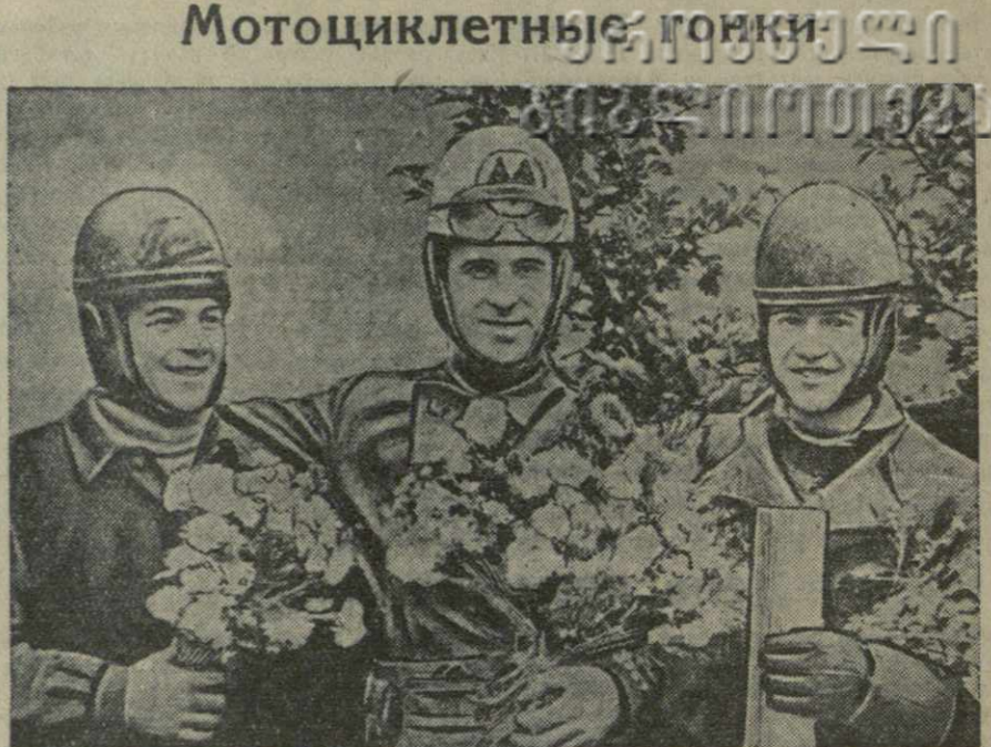
8 ноября на набережной имени Сталина впервые в Тбилиси были проведены мотоциклетные гонки по замкнутому кругу.