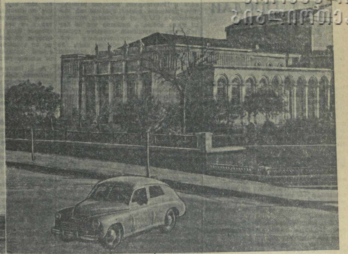
Гори сегодня. Слева — домик, в котором родился и провел годы детства товарищ Сталин. Над реставрированным домиком сооружен павильон; в центре — монумент товарища Сталина у городского вокзала; справа — здание Горького государственного театра.