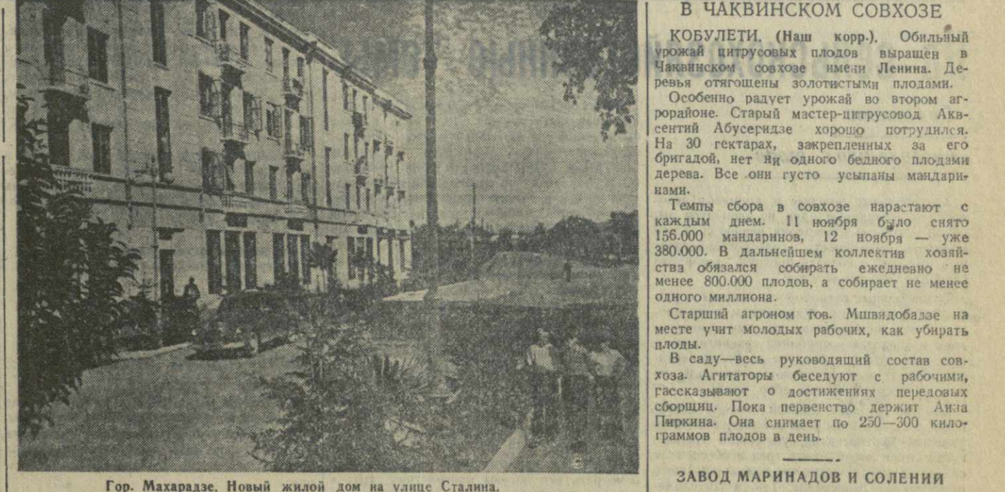
Гор. Махарадзе. Новый жилой дом на улице Сталина.

БАТУМИ. (Наш корр.). Расширяется сеть мелких гидроэлектростанций в горных районах Абхазии. В районном центре Хуло заканчивается сооружение межколхозной гидроэлектростанции, которая будет обслуживать 12 сельскохозяйственных артелей. В Батумском районе развернулось строительство крупнейшей в Абхазии сельской гидроэлектростанции на реке Махо мощностью в 600 лошадиных сил. До конца года закончится сооружение новых электростанций в селениях Агара, Мерси и Ахо Келского района, Агадзиев Хулоского района и Чухунети Батумского района. Большую помощь строительству мелких гидроэлектростанций оказывают шефы — Батумский ремонтно-механический завод Министерства местной промышленности Абхазии и судоремонтный завод.