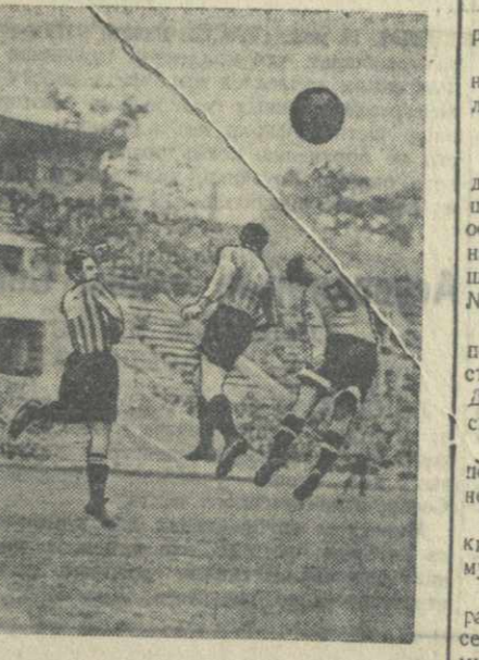
На снимке: момент игры между командами «Динамо» (Тбилиси) и Военно-Воздушной Силы, состоявшийся 15 мая на московском стадионе «Динамо» и закончившейся победой тбилисцев со счетом 4:0.