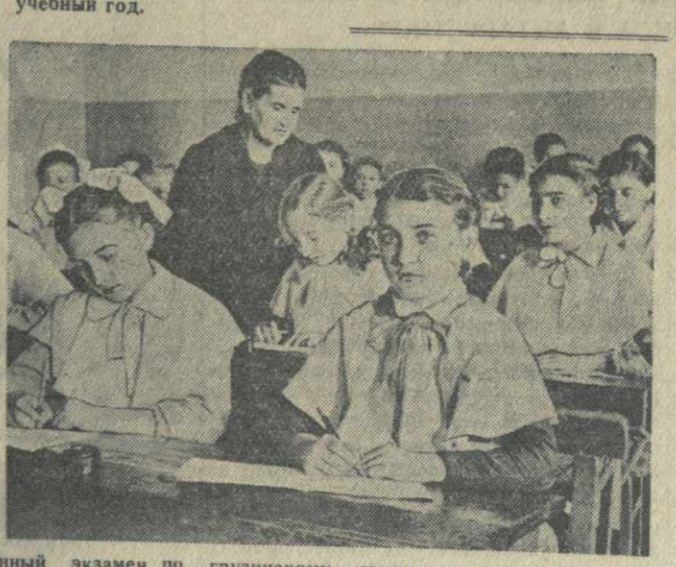
Экзамены в школах Тбилиси. На снимках: слева — письменный экзамен по русскому языку и литературе в IV классе 14-й школы. Справа — экзамен по арифметике в IV классе 14-й школы.