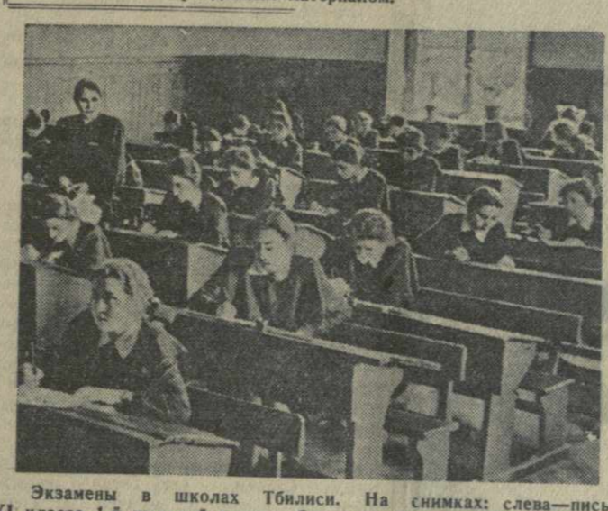
Экзамены в школах Тбилиси. На снимках: слева — письменный экзамен по русскому языку и литературе в IV классе 14-й школы. Справа — экзамен по арифметике в IV классе 14-й школы.

Педагог и учащиеся хорошо поработали, готовясь к испытаниям. Многие школьники отвечали на экзаменах значительно лучше, чем на уроках, и заслуженно получили более высокие оценки.