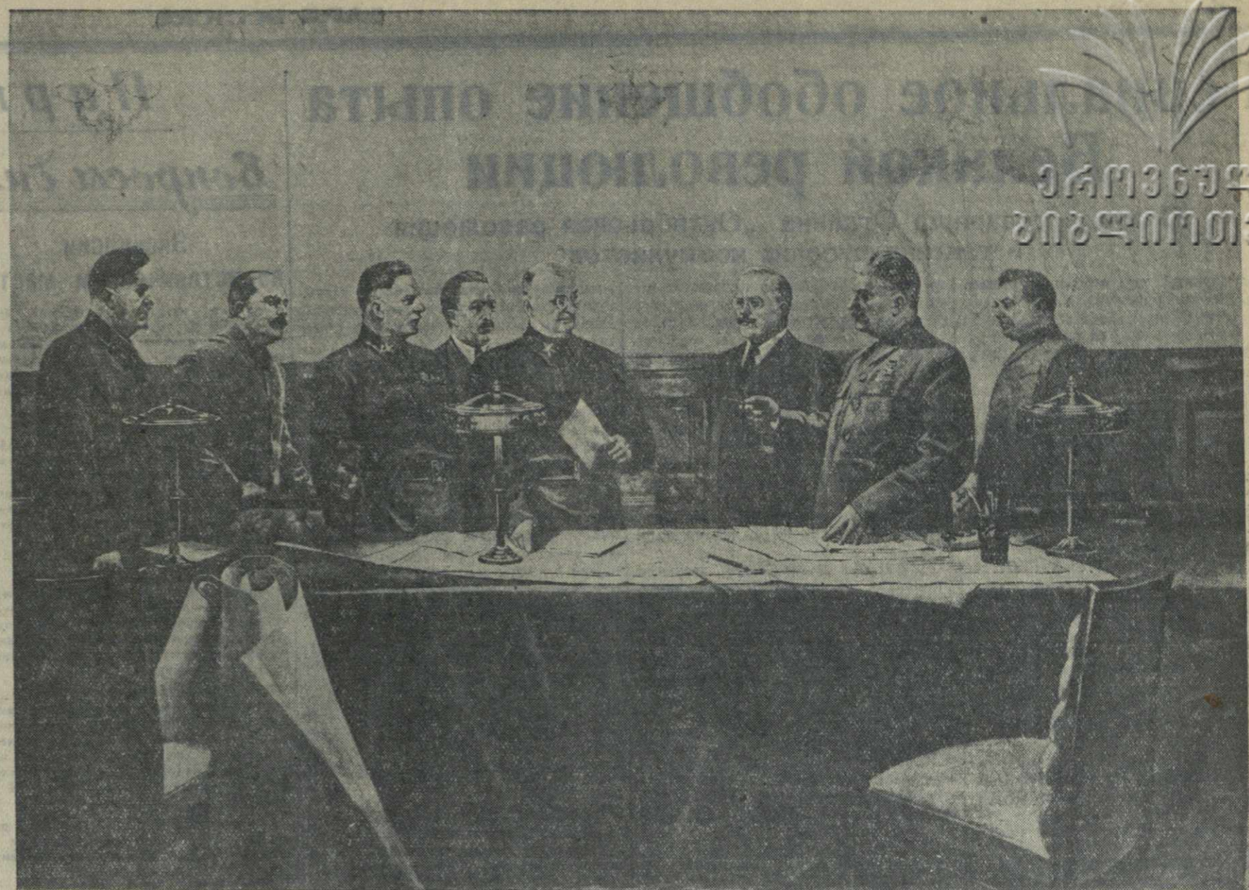
«Заседание Государственного Комитета Обороны». Репродукция с картины художника И. Вепхвадзе.

Под руководством партии Ленина — Сталина, самозабвенно преданные великому Сталину, труженики колхозной деревни Грузии уверенно идут к новым и новым достижениям, умножают свой вклад в строительство коммунизма.