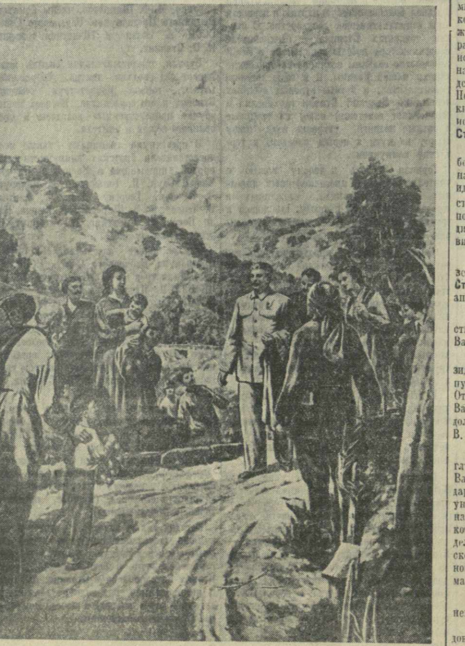
«Товарищ Сталин среди колхозников Грузии». Репродукция с картины художника Г. Чириншвили.

После заседания состоялся большой концерт. (ТАСС).