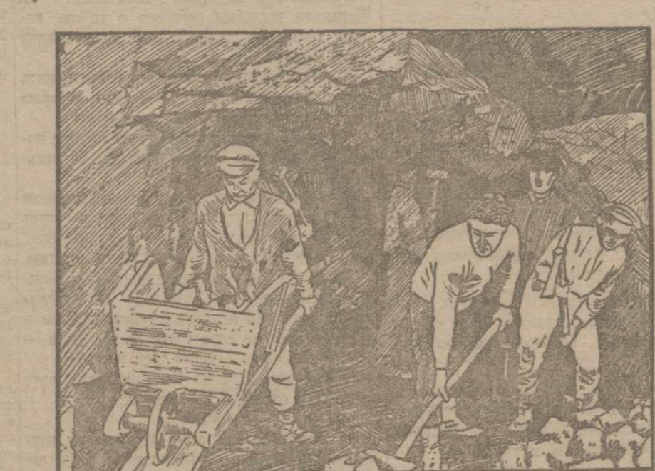
Пробитая отводная для реки Арпа чай у места постройки плотины.

В восьмидесяти верстах от турецкой границы и в 12 от Леннакана тянется рабочий-крестьянский район и ночь, круглые сутки, гремят громадные машины для Арпачая — Ширакский канал имени Ленина.