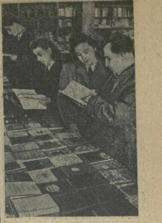
Болгария. Союз болгаро-советских обществ открыл в Софии несколько книжных магазинов. В них имеется большой выбор книг советских писателей на русском языке. На снимке: в книжном магазине.

Н. ТУШИВИЛИ, директор Тбилисской камвольной-суконной фабрики «Советская Грузия».