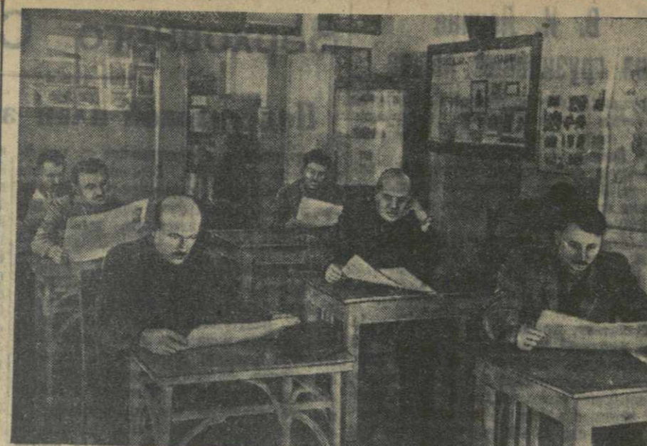
В читальном зале Зугдидской городской библиотеки.

Сегодня, когда советский народ отдает свои силы сознательному труду, борется за досрочное выполнение послевоенной сталинской пятилетки, Краснознаменная Амурская флотилия стоит бдительным часовым на дальневосточных границах нашей великой Родины.