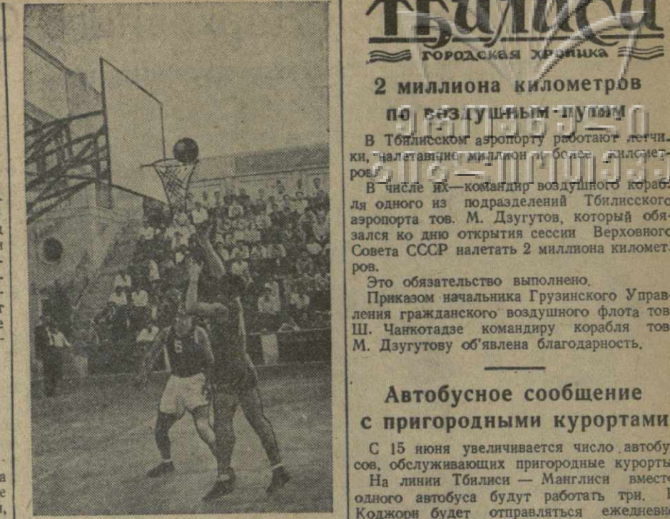
На городском баскетбольном стадионе состоялся финальный матч розыгрыша Кубка Грузии по баскетболу между командами «Динамо» (Тбилиси) и «Большевик» (Кутаиси). На снимке: момент игры у дуга кутаисцев.

Игра закончилась счетом 2:1 в пользу команды «Крылья Советов».