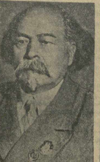
Д. И. Аракишвили, композитор.