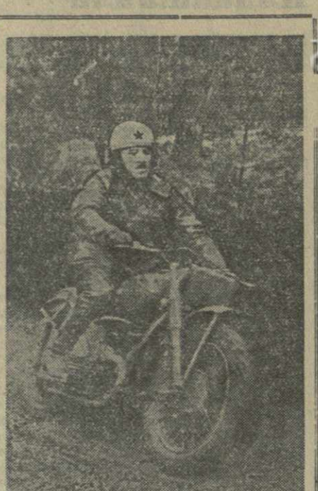
В аллее парка культуры и отдыха имени Орджоникидзе состоялась кольцевая мотогонка, посвященная выборам в Верховный Совет Грузинской ССР.

В аллее парка культуры и отдыха имени Орджоникидзе состоялась кольцевая мотогонка, посвященная выборам в Верховный Совет Грузинской ССР. Участвовали спортсмены ДОСАРМ Тбилиси, Закавказского военного округа, Грузинского окружного Дома офицеров и добровольных спортивных обществ «Буревестник», «Труд» и «Наука».