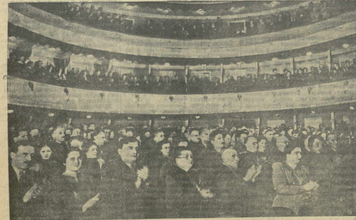
Предвыборное собрание избирателей Ленинского избирательного округа города Тбилиси в театре имени Руставели 8 февраля 1951 года.

Управляющий комбинатом «Грузголь» тов. Б. Гуджеджани говорил о том, что на шахтах лучше стали соблюдаться правила технической эксплуатации и техники безопасности. Комбинат проводит мероприятия, которые резко улучшат условия труда шахтеров. Тов. Гуджеджани заметил, что комбинату в этом деле потребуется помощь профессиональных союзов и, в первую очередь, Грузинского республиканского комитета профсоюза угольщиков. Профессиональные организации должны