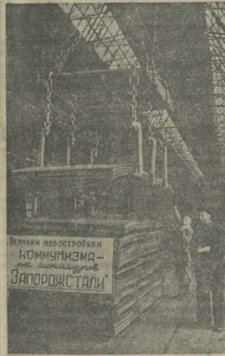
Запорожская область. Металлургия завода «Запорожсталь» выполняют почетный заказ для великих строек коммунизма. Коллектив токолистского цеха выполняет задание на 26 дней ранее срока. Прокатаны сотни тонн стального листа специального профиля, из которого будут изготовлены подъемные механизмы для «Куйбышевгидростроя». На снимке: подготовка стальных листов к отправке.

1951 год — последний год, предшествующий соединению Волги и Дона. Весной будущего года волжские теплоходы поплывут по трассе нового канала — одного из величайших сооружений сталинской эпохи.