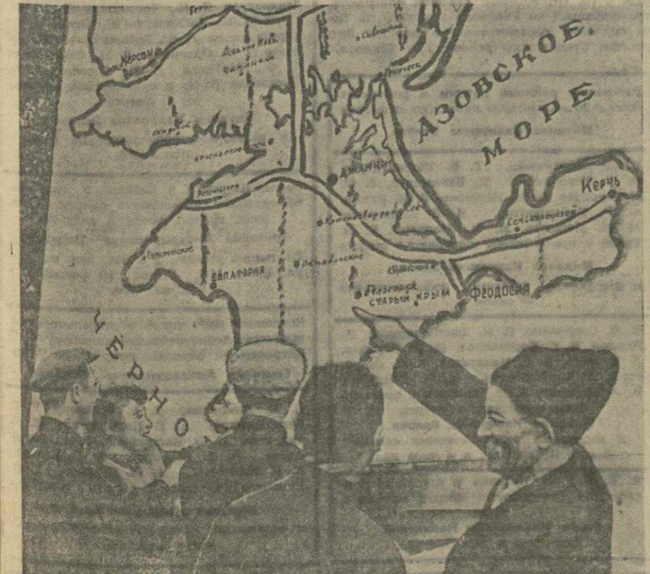
Крымская область. Жители городов и сельских районов области с большой радостью встретили постановление Совета Министров СССР о строительстве Северо-Крымского канала и орошении земель Джанкой у селения будущего.

колхозник артели имени Калининна села Чумлаки Гурджаанского района.