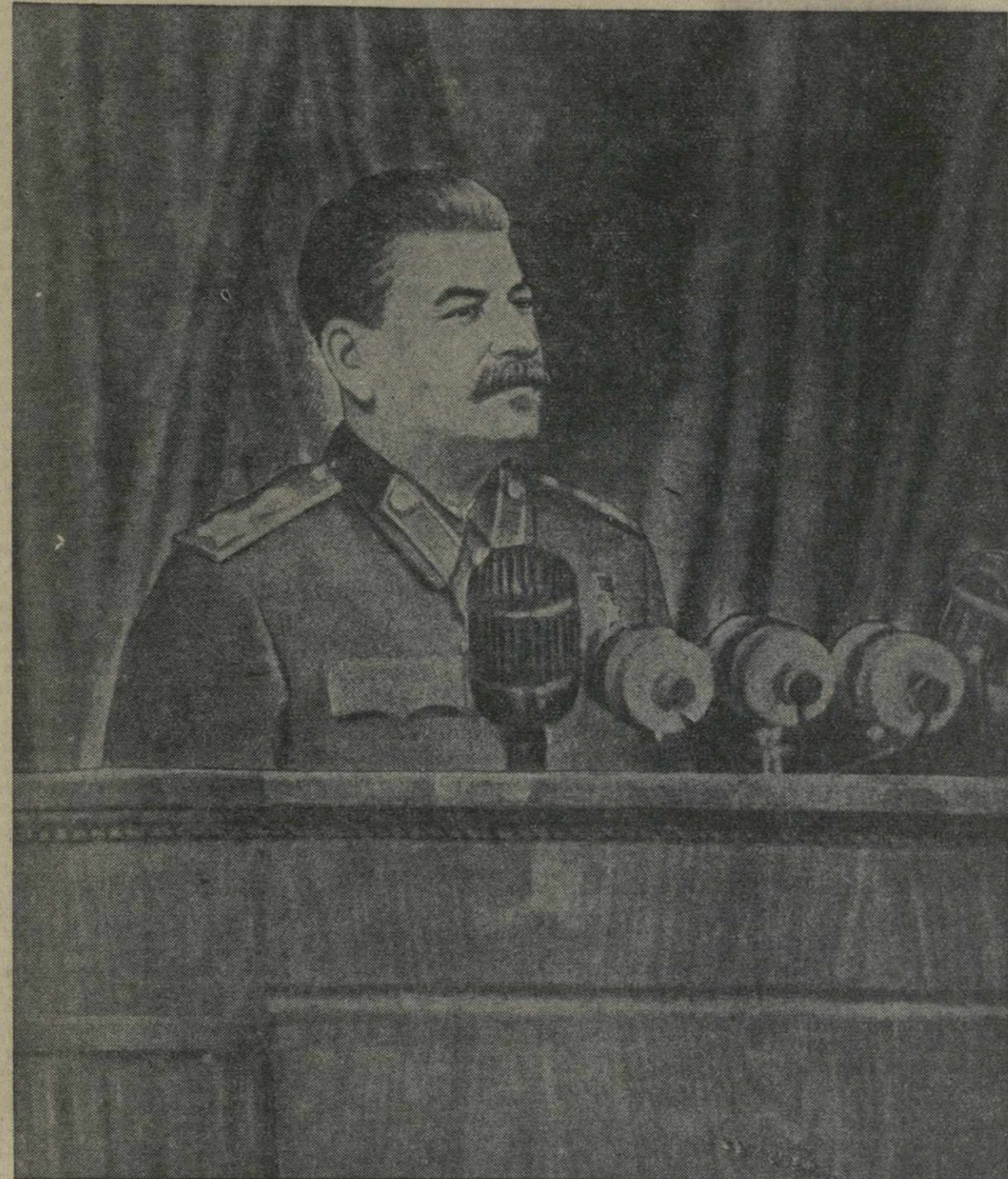
Выступление товарища И. В. Сталина на предвыборном собрании избирателей Сталинского избирательного округа г. Москвы 9 февраля 1946 года.