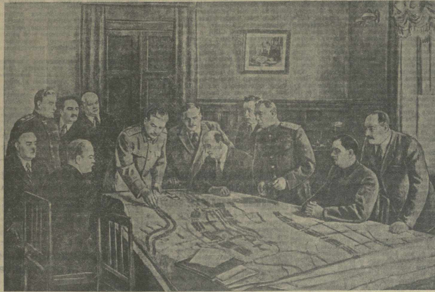
ДЛЯ СЧАСТЬЯ НАРОДА. Заседание Политбюро ЦК ВКП(б).