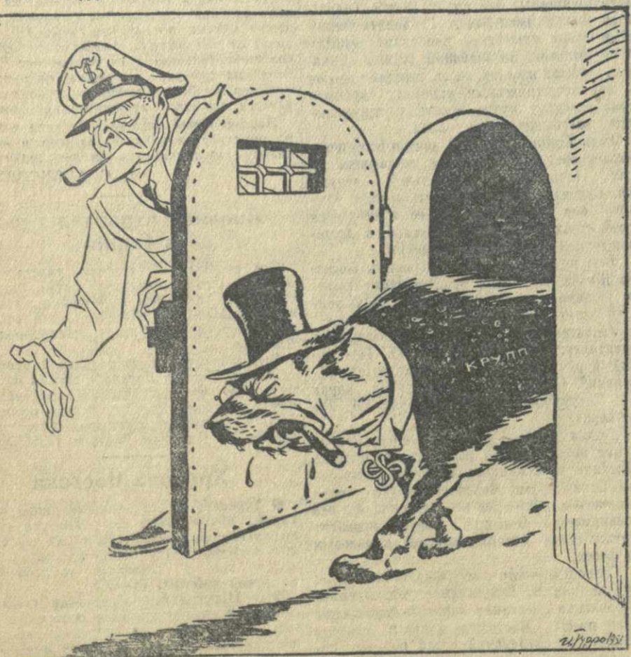
Рис. И. Турро

Американские оккупационные власти в Западной Германии производят массовое освобождение немецких военных преступников. На днях из тюрьмы выпущен гитлеровский пушечный король Альфред Крупп. (Из газет.)