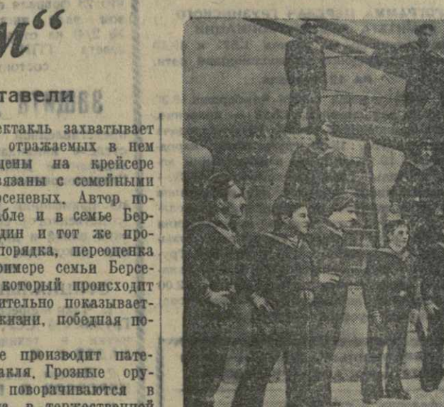
Сцена из спектакля «Разлом» в театре имени Руставели.

Пьеса «Разлом» идет в театре имени Руставели в постановке народного артиста