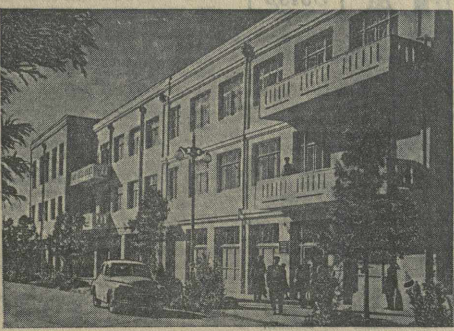
Город Цхакава. На улице имени Ленина.