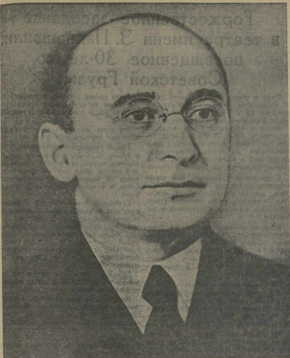
Лаврентий Павлович Берия.