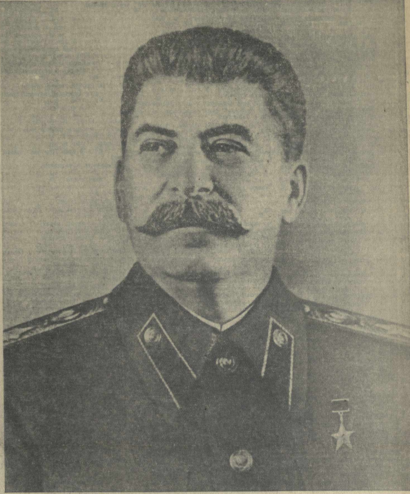
Иосиф Виссарионович СТАЛИН.