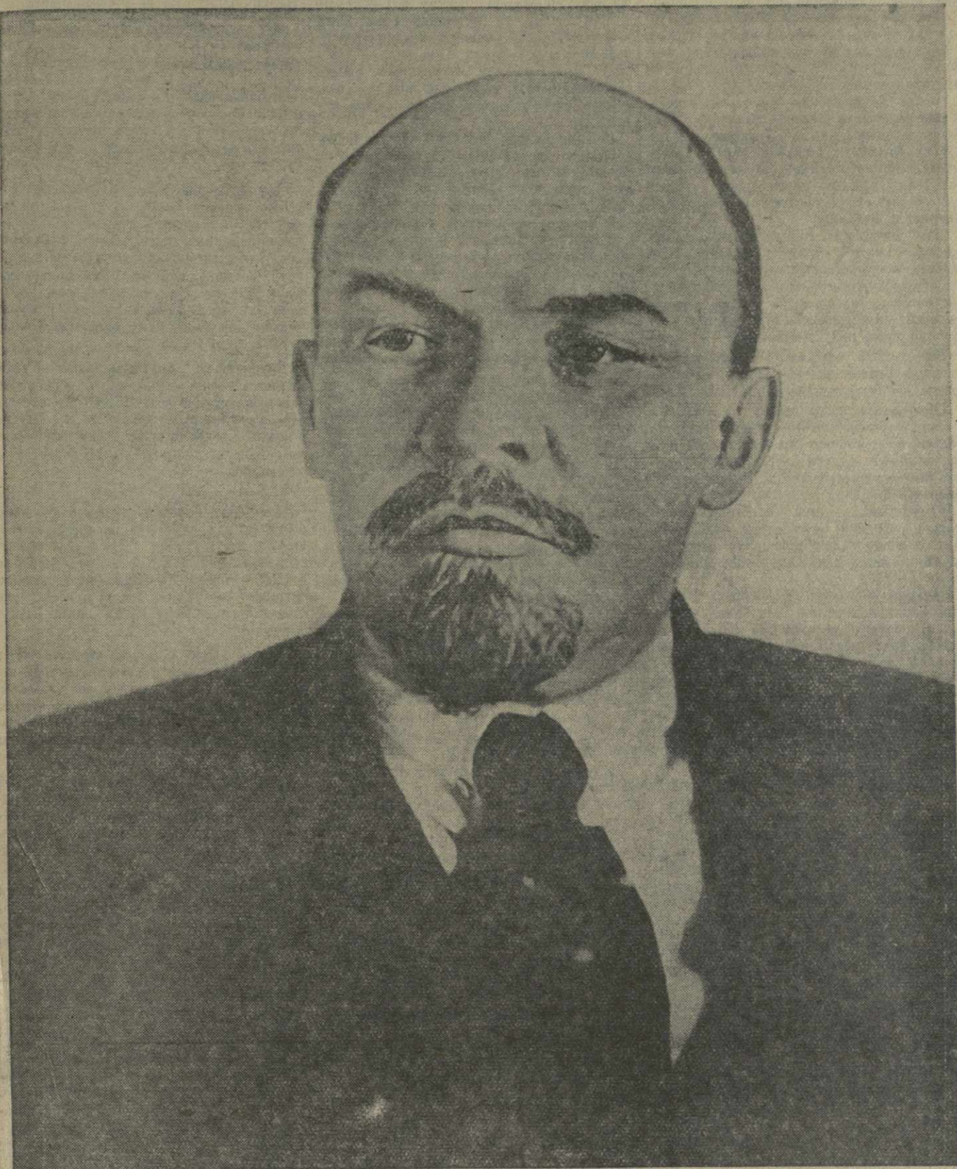
Владимир Ильич ЛЕНИН.