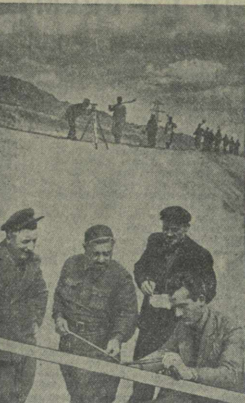
Решающее значение для стройки имеет подготовка кадров для производства железобетонных работ. Необходимо также закрепить на производстве те 1.000 человек, которые прибыли к нам в мае — июне по организованному набору из районов республики. Особое внимание должно быть обращено на своевременный завоз материалов, лучшее использование механизмов, проведение дорог, подготовку к зиме, развертывание жилищного строительства, в первую очередь в районах Орхеви, Лило и Соледных озер.

Самгорская стройка выполнила план первого полугодия. Коллектив ее стремится успешно выполнить и перевыполнить весь план 1950 года. С этой целью между участками развернулось социалистическое соревнование. Учреждено переходящее Красное знамя для лучшей бригады стройки. Воодушевленный вниманием и поддержкой всех трудящихся Грузии, коллектив строителей Самгори приложит все силы к тому, чтобы с честью выполнить все возложенные на него почетные задачи.