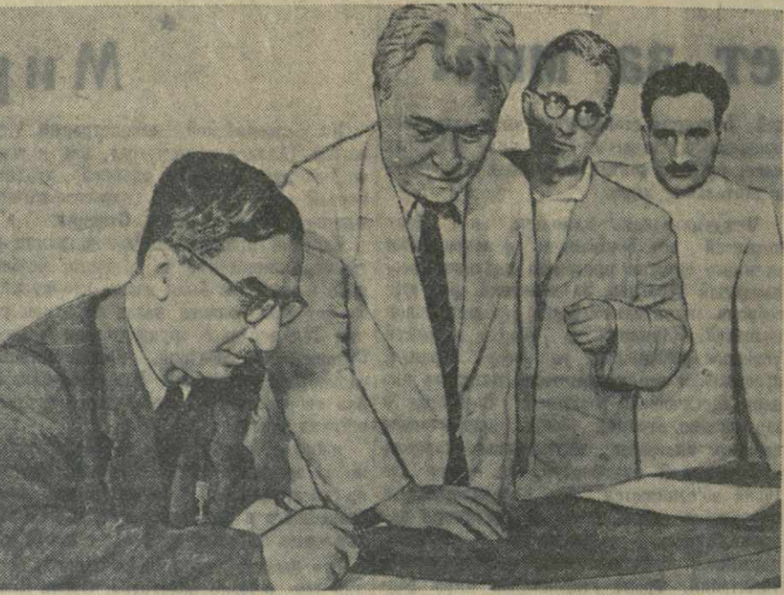
В Академии наук Грузинской ССР. Воззвание Постоянного комитета Всемирного конгресса сторонников мира подписывают (слева направо): академик Н. И. Мусхелишвили, действительные члены Академии наук Грузинской ССР К. С. Кекелидзе, Г. С. Ахвледиани и Р. И. Агладзе.