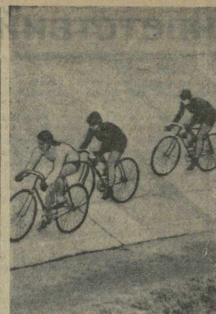
Велосипедисты на тбилиском трекке.