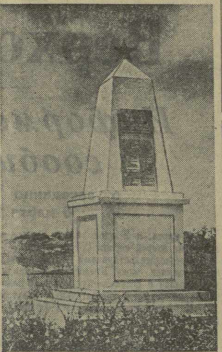
Обелиск-памятник воинам-героям, павшим в боях за освобождение Анапы.