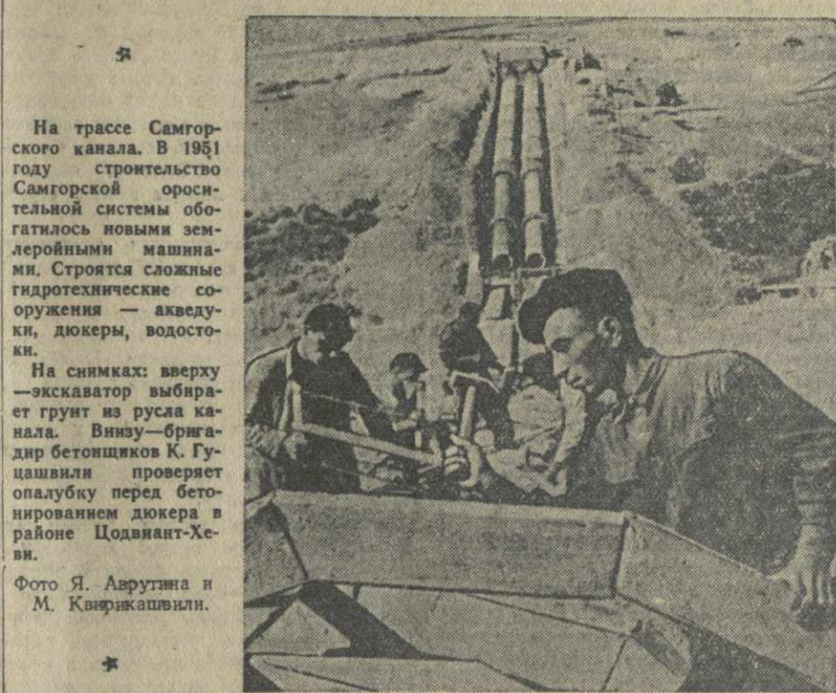
На трассе Самгорского канала. В 1951 году строительство Самгорской оросительной системы обогатилось новыми землеройными машинами. Строится сложные гидротехнические сооружения — аведуки, дюкеры, водостоки.