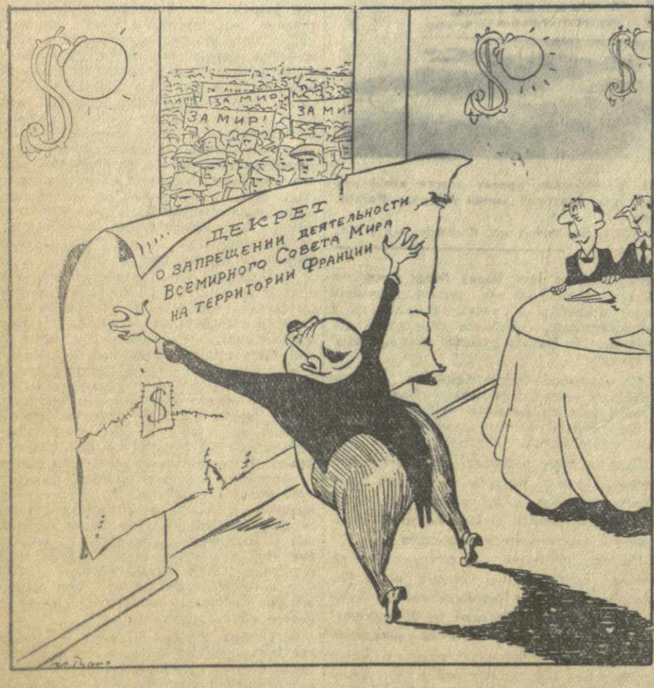
Рис. И. Гурро.

Решение французского правительства о запрещении деятельности Всемирного Совета Мира на территории Франции вызвало волну протестов во всем мире. Это решение не будет иметь никакой силы, ибо мощь Всемирного Совета Мира во Франции зиждется на миллионах французских и французских, объединенных в борьбе за мир.