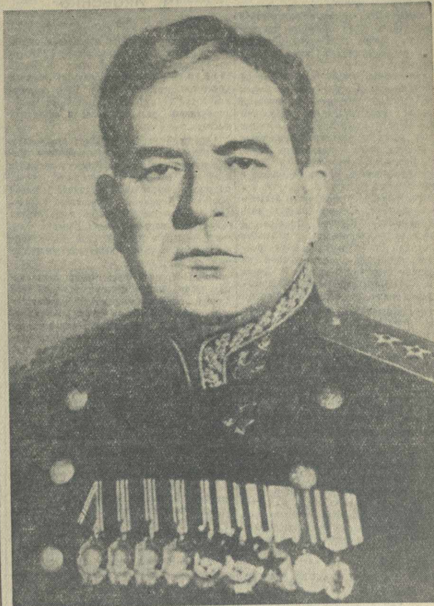
Военно-Морской Министр Союза ССР адмирал И. С. ЮМАШЕВ.

Торжественно отмечают День Военно-Морского Флота трудящиеся столицы. В садах и парках организуются массовые гуляния. В гости к москвичам приехали матросские ансамбли песни и пляски с Балтийского и Черного морей. 23 июля на Москверке ДОСФЛОТ проводит большой водно-спортивный праздник. Здесь же состоится финиш звездного шлюпочного перехода с флотов и флотилий в Москву. (ТАСС).