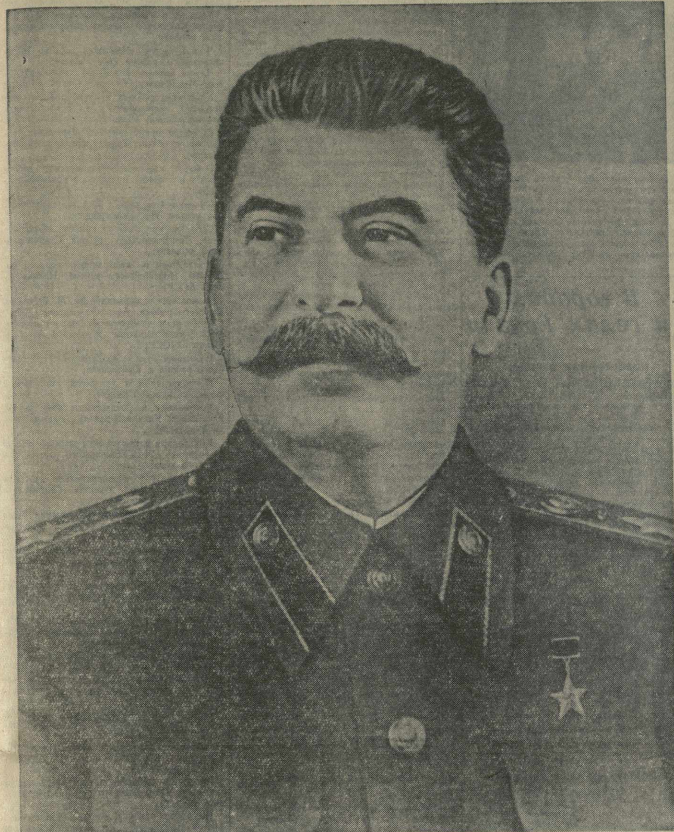
Иосиф Виссарионович СТАЛИН.