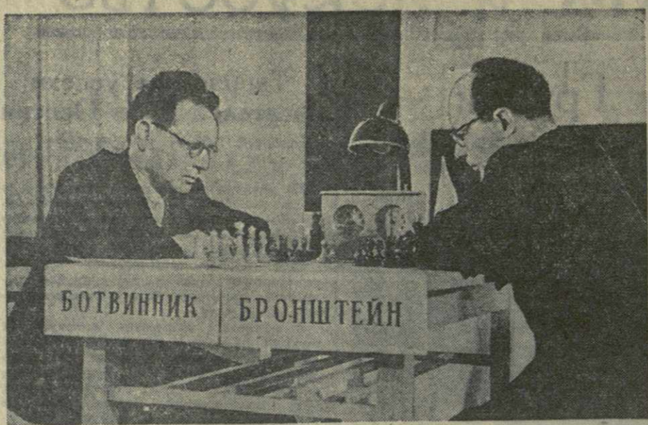
Шахматный матч на первенство мира между чемпионом мира М. Ботвинником и гроссмейстером Д. Бронштейном. На снимке — М. Ботвинник (слева) и Д. Бронштейн.

КОМАНДОВАНИЯ НАРОДНОЙ АРМИИ ПХЕНЬЯН, 12 мая. (ТАСС). Главное командование Народной армии Корейской Народно-Демократической Республики сообщило сегодня, что на Западном и Восточном фронтах части Народной армии в тесном взаимодействии с китайскими добровольцами, отбивая контратаки противника, наносят ему большие потери в живой силе и технике. На Центральном фронте особых изменений не произошло. ПХЕНЬЯН, 13 мая. (ТАСС). Главное командование Народной армии Корейской Народно-Демократической Республики сообщило сегодня, что на всех фронтах части Народной армии в тесном взаимодействии с китайскими добровольцами, отбивая контратаки противника, наносят ему большие потери в живой силе и технике. Части Народной армии сбив 7 самолетов противника.