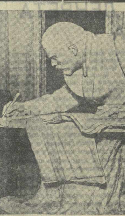
Центральный музей В. И. Ленина. Экскурсаны у скульптуры «Ленин в Разлив».

В годы столыпинской реакции в годы жестокого царского террора Ленин и Сталин, собирая и сплачивая ясные партии, вели упорную борьбу против всех антипартийных течений. На Пражской конференции в 1912 году большевики оформились в самостоятельную пролетарскую партию — партию нового типа.