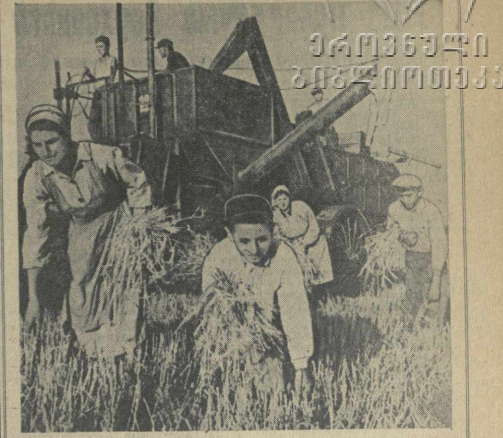
Для борьбы с потерями зерна колхоз имени Сталина Цителкаркойского района создал бригады по сбору колосков. В борьбе с потерями урожая колхозу большую помощь оказывают школьники. На снимке: школьники собирают колоски.