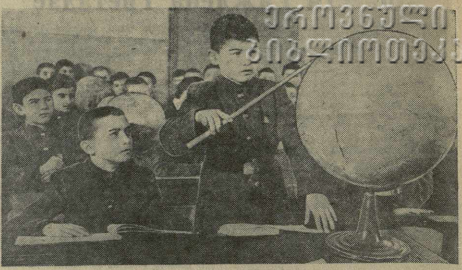
Школьники Тбилиси готовятся к начинающимся 21 мая переводным испытаниям и выпускным экзаменам. Повторя пройденный материал, учащиеся широко пользуются консультациями педагогов. На снимке: ученики 6 класса 1-й Тбилисской средней мужской школы повторяют курс географии.