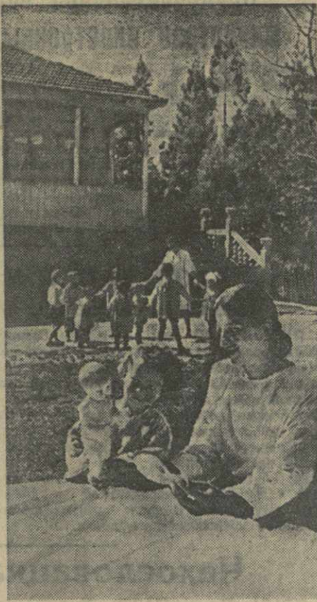
В детском саду бригады № 3 Натанебского колхоза имени Л. П. Берия Махарадзевского района.