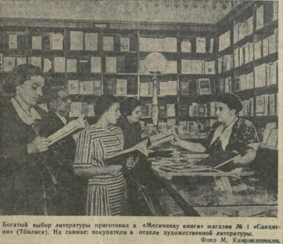
Богатый выбор литературы приготовили к «Месачнику книги» магазин № 1 «Сакитини» (Тбилиси). На снимке: покупатели в отделе художественной литературы.