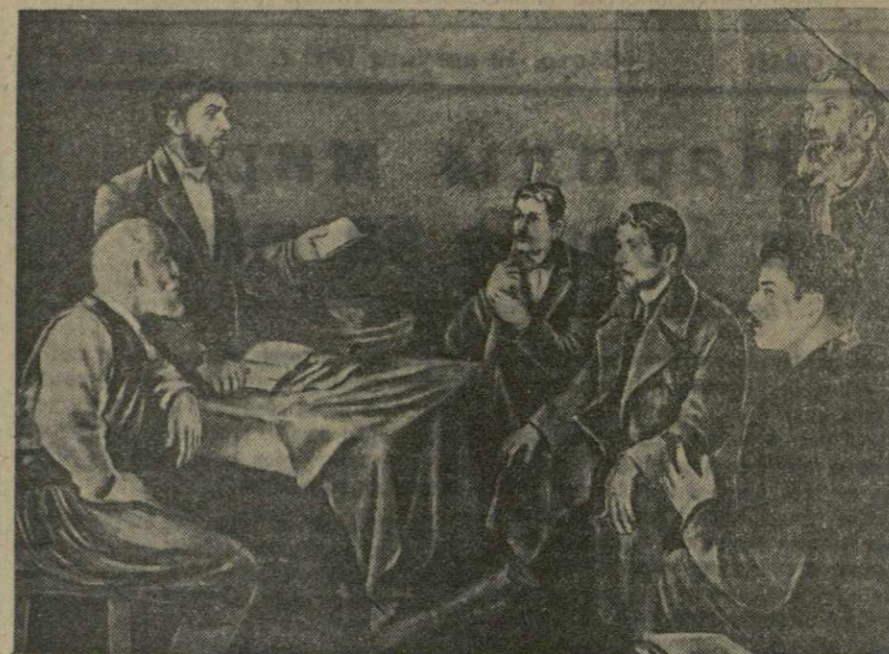
Начало организованного революционного движения рабочих в Грузии и Закавказье связано с тем периодом, когда под руководством молодого Сталина сложилась и оформилась Центральная социал-демократическая группа тбилисской организации. Она широко развернула работу по созданию нелегальной социал-демократической партийной организации.

«Рабочее движение в Тифлисе, — говорит в Краткой биографии Иосифа Виссарионовича Сталина, — в этот период начинает выходить из рамок старой, чисто пропагандистской работы с выдающимися единицами из рабочих. Агитация в массах путем выпуска листовок на злободневные темы, путем летучих собраний и политических демонстраций против царизма выдвигается жизнью на первый план».