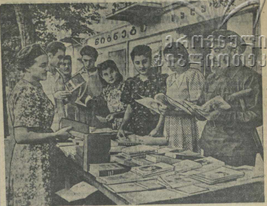
Месячник книги в Тбилиси. На снимке: у книжного лотка магазина «Сакцигин» № 1 на проспекте Руставели.

Избран новый президиум республиканского совета добровольного спортивного общества «Буревестник» в составе 9 человек.