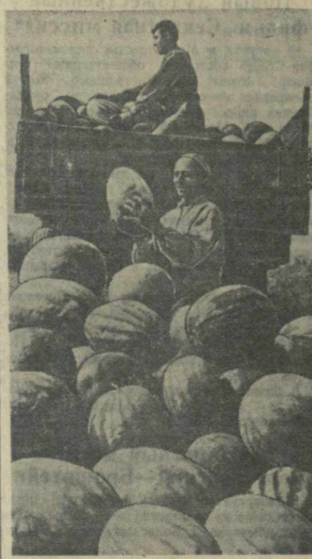
У крупный колхоз имени Сталина Лагодзского района. На артельной бахче.