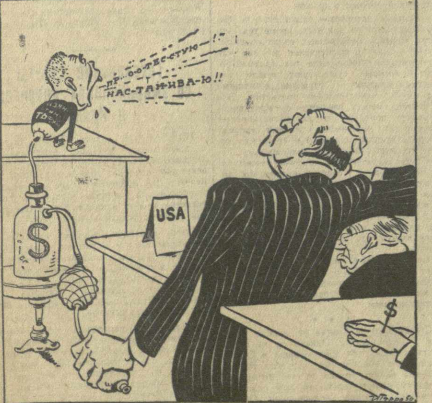
...или — Цзян Тин-Фу...

Гоминдановец Цзян Тин-фу произносит каждый раз в Совете Безопасности речи по шпаргалке американского делегата Остина. (Из газет).