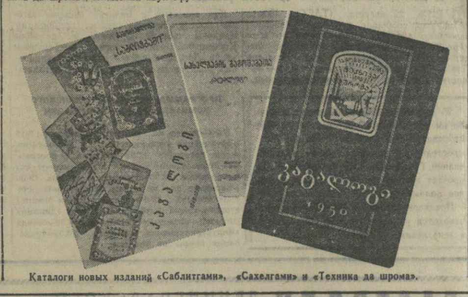
Каталоги новых изданий «Саблантами», «Сакелгами» и «Техника да шрома».

ПАРИЖ, 22 августа. (ТАСС). Газета «Юманите» сообщает, что правительство Демократической республики Вьетнам опубликовало декларацию, в которой говорится: «Французские колонизаторы пришли во Вьетнам, чтобы развязать войну и творить насилие над вьетнамским народом на его собственной земле. Мы не собираемся идти воевать во Францию. Мы не собираемся заточать французов в тюрьмы на их земле. Во имя человечности и для того, чтобы по-