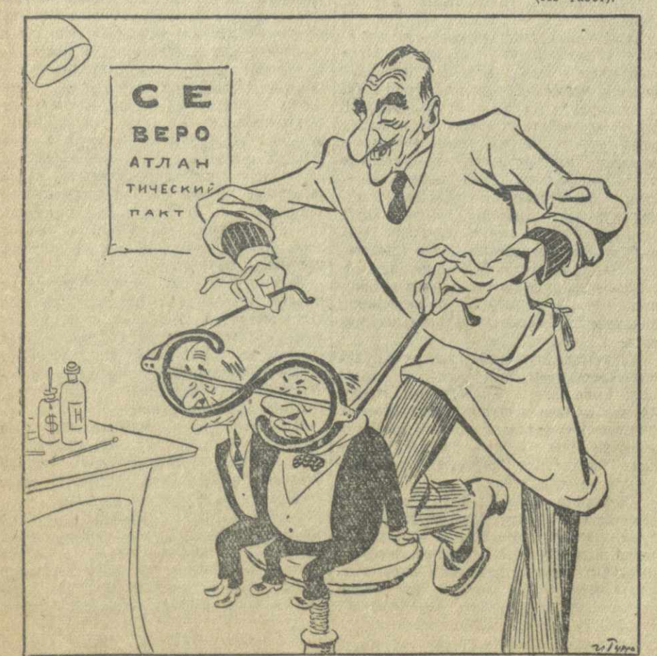
... или — американские очки

Правящая клика Соединенных Штатов Америки пытается установить единство взглядов с Англией и Францией. (Из газет).