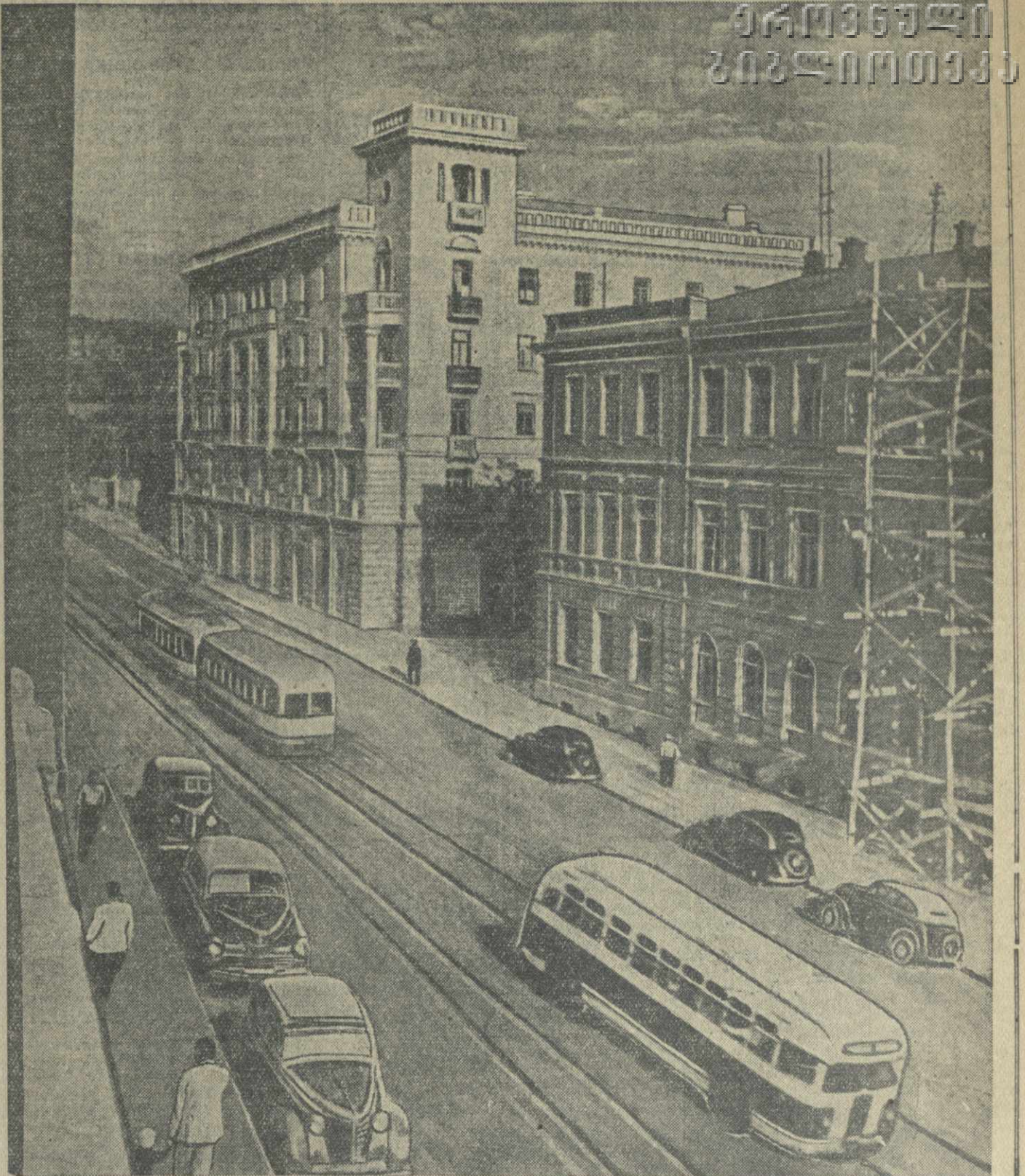
В каждом большом городе привокзальный район — один из самых важных и оживленных. Это — ворота города.

Привокзальная улица в Тбилиси в последние годы стала особенно тесна, узка. Она уже не соответствовала темпам жизни города, не гармонировала с его достижениями в благоустройстве, с большим размахом его строительных работ.