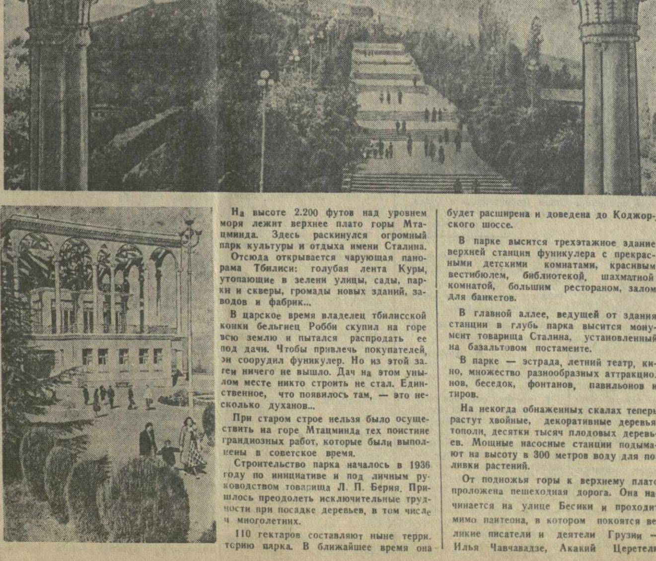
10. Парк культуры и отдыха имени Сталина