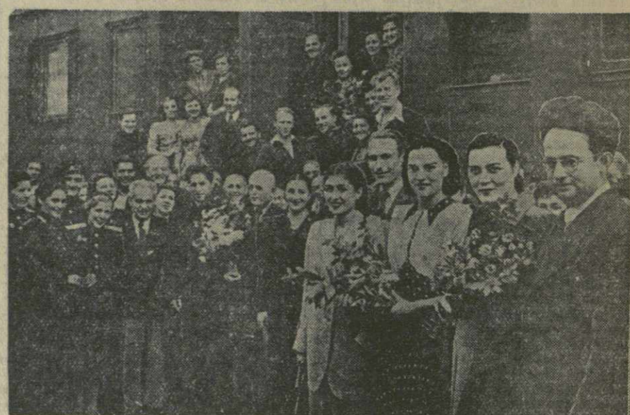
Концерт в клубе имени Плеханова начал вчера свои гастроли в Тбилиси Московский железнодорожный ансамбль песни и пляски под художественным руководством лауреата Сталинской премии, заслуженного деятеля искусств, композитора И. Лубан.

В составе ансамбля 105 человек. В его репертуаре — песни народов СССР и песни борьбы за мир, русские, украинские, белорусские, польские, чешские, молдавские, карело-финские пляски.