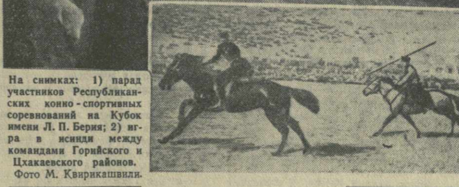
На снимках: 1) парад участников Республиканских конно-спортивных соревнований на Кубок имени Л. П. Берия; 2) игра в исинди между командами Горьиского и Цхакаевского районов.